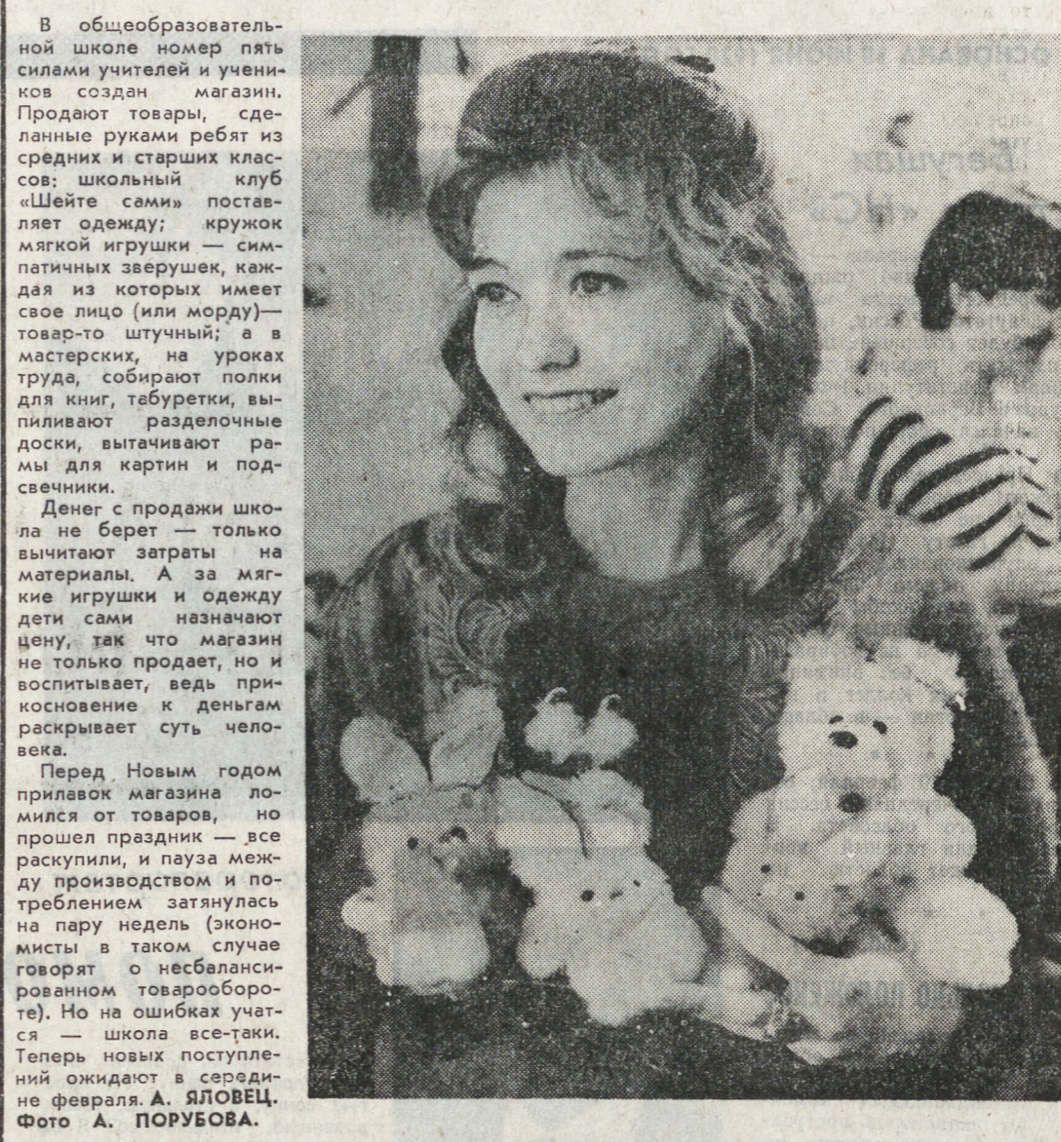
В общеобразовательной школе номер пять силами учителей и учеников создан магазин. Продаются товары, сделанные руками ребят из средних и старших классов: школьный клуб «Шейте сами» поставляет одежду; кружок мягкой игрушки — симпатичных зверушек, каждая из которых имеет свое лицо (или морду) — товар-то штучный; а в мастерских, на уроках труда, собирают полки для книг, табуретки, вышивают разделочные доски, вытачивают рамы для картин и подставки.

Денег с продажи школа не берет — только вычитают затраты на материалы. А за мягкие игрушки и одежду дети сами назначают цену, так что магазин не только продает, но и воспитывает, ведь прикосновение к деньгам расширяет суть человека. Перед Новым годом прилавок магазина ломился от товаров, но прошел праздник — все раскупили, и пауза между производством и потреблением затянулась на пару недель (экономисты в таком случае говорят о несбалансированном товарообороте). Но на ошибках учиться — школа все-таки. Теперь новых поступлений ожидают в середине февраля. А. ЯЛОВЕЦ.