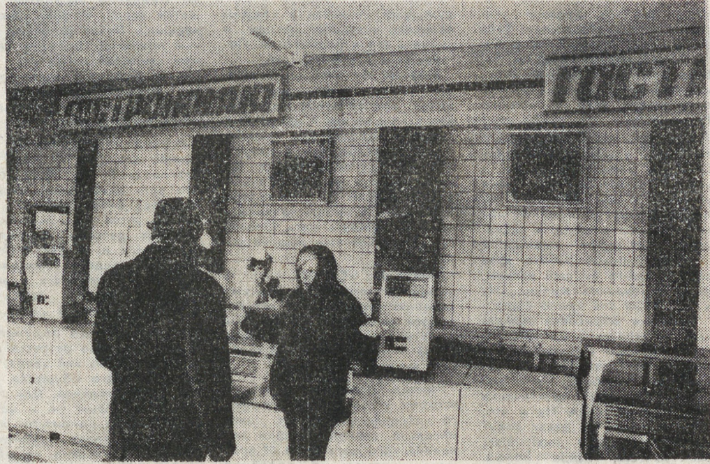
будущее в игрушечно-гастрономической сфере. Как говорят кулинары, первый блин в организации подобных выставок получился комом.

Что касается игрушек, здесь смотреть было нечего. Наверное, нам сегодня не до игрушки. Хотя выставку посетили представители Уральского оптико-механического завода и НПО «Автоматика».