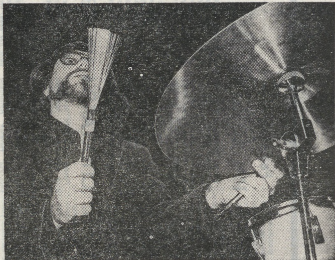
Фестиваль «Из Нового света»