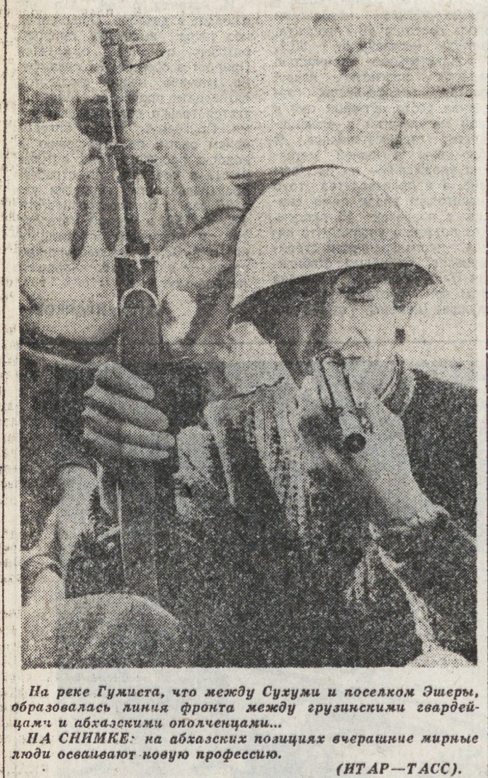
На реке Гумиста, что между Сухуми и поселком Шерва, образовалась линия фронта между грузинскими гвардейцами и абхазскими ополченцами... НА СНИМКЕ: на абхазских позициях вчерашние мирные люди осваивают новую профессию.