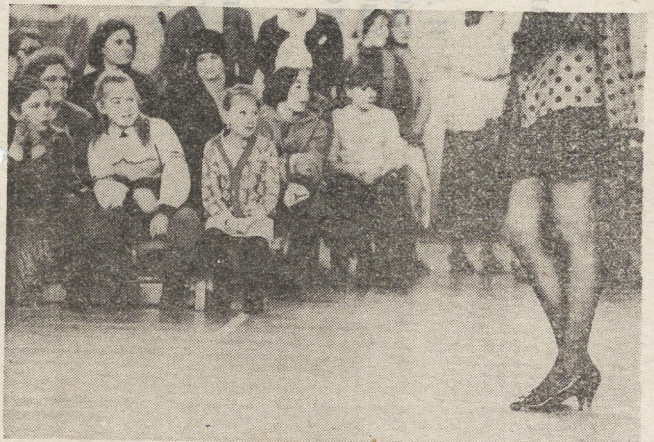
Фото Андрея ПОРУБОВА, Екатеринбург.