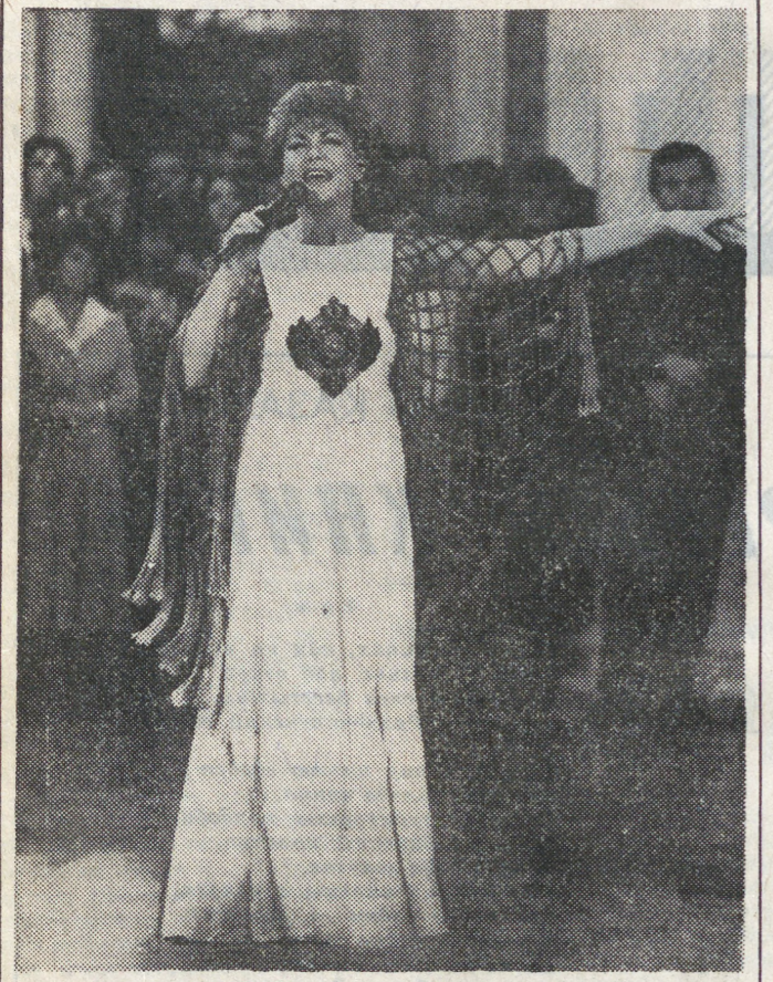
САНКТ-ПЕТЕРБУРГ. На бал в роскошных гостиницах Анчонова дворца собралась своих друзей народная артистка России Эдита Пехя, которая отмечает 35-летие творческой деятельности на концертных подмостках. НА СНИМКЕ: Эдита Пехя на балу.

1. Орнестровое вступление к опере. 2. Неоднократно повторяющаяся характерная группа звуков. 3. Персонаж оперы М. Мусоргского. 4. Соброчная армия. 5. Литовский музыкальный инструмент. 6. Мелодрама русского композитора Е. Фомина. 7. Симфоническая поэма М. Балакирева. 8. Литературный сценарий балета. 9. Опера Я. Перси. 10. Небольшой переносный орган. 11. Автор балетов «Золушка», «Ромео и Джульетта». 12. Приспособление для приглушения звука в фортепиано. 13. Однорядная гармонь. 14. Французский поэт-песенник. 15. Мужской голос. 16. Героиня оперы Р. Вагнера «Летучий голландец». 17. Форма многоголосной музыки, основанная на имитации. 18. Жанр вокальной музыки XVI-XVII вв. 19. Интонационно-сценическое произведение немедленного содержания. Опера для детей М. Кривяца. 21. Композитор, автор балета «Днялль». 22. Небольшая по форме опера. 23. Итальянское обозначение умеренного темпа. 24. Опера Ю. Миллота. 25. Поэт-песенник, создатель новой школы дирижирования. 26. Французский композитор, создатель новой школы дирижирования. 27. Опера Г. Берлиоза. 28. Начало хоральной песни. 29. Ансамбль из восьми музыкантов. 30. Горизонтальная линия, заменяющая нотный стан в партитуре. 31. Персонаж оперы «Ромео и Джульетта». 32. Чешский композитор и дирижер автор симфонической поэмы «Тарас Бульба». 33. Диэз. 34. Польский народный танец. 35. Музыкально-сценическое произведение. 36. Музыкально-сценическое произведение немедленного содержания. Составил Г. БЛОХИН.