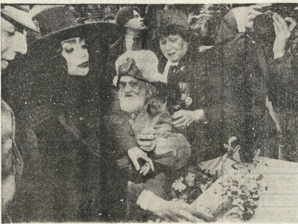
ПАРИЖ. Американская певица Лолой Джексон, старшая сестра популярного Майкла Джексона и нынешняя звезда известной кабаре «Мулен руж», возлагает цветы на кладбище Монпарнас, последнем пристанище многих знаменитых французских артистов.