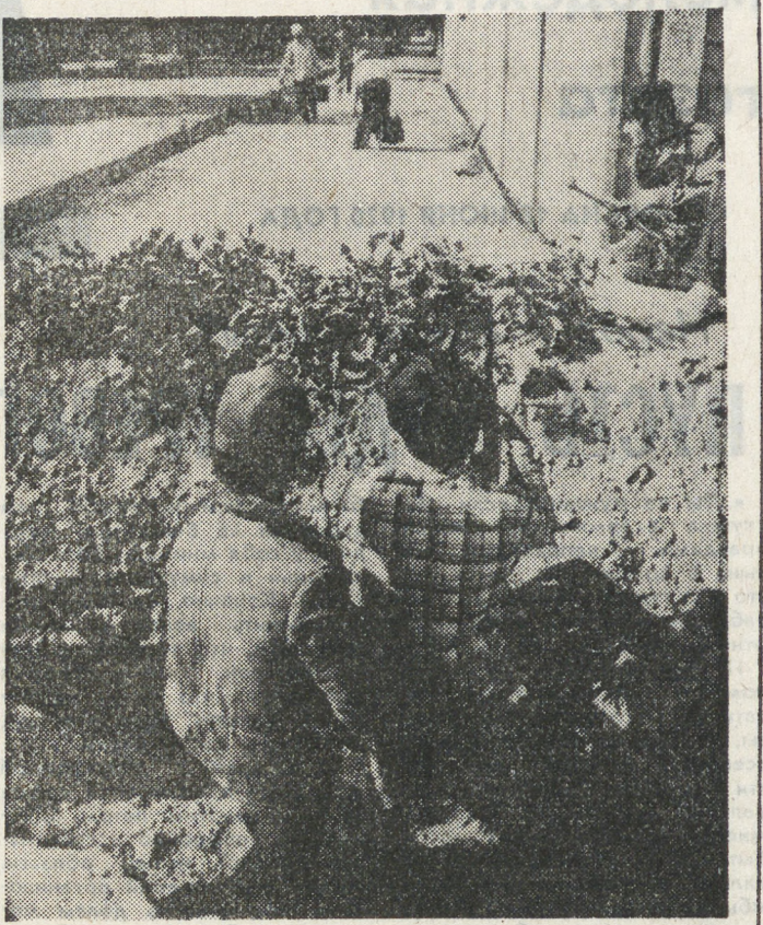
ТАДЖИКИСТАН. Обстановка в Курган-Тюбе и окрестностях остается сложной. Короткие затихшие перестрелки и кровавые столкновения, в результате которых в первую очередь страдают ни в чем не повинные женщины, дети и старики. Опустели улочки Курган-Тюбе, большая часть населения покинула этот город — эпицентр вооруженного конфликта.

НА СНИМКЕ: один из многочисленных постов сил «самообороны».