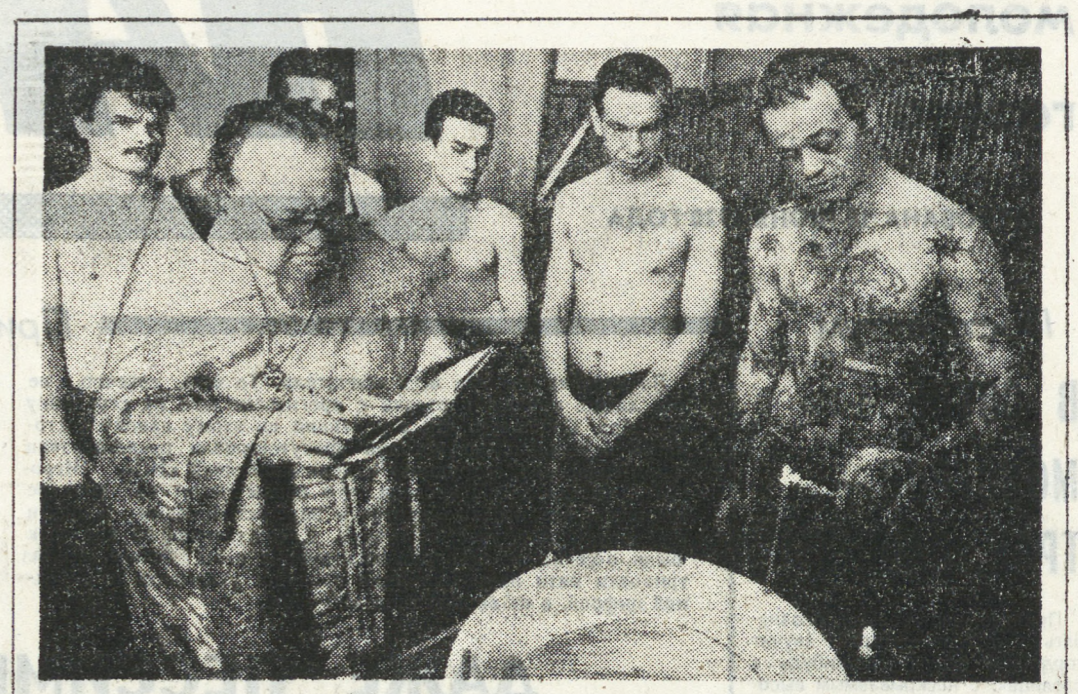
День города, помимо многолюдных гуляний, был ознаменован и еще одним, может быть не таким ярким, событием. В следственном изоляторе № 1 города Екатеринбург приняла православная орадерная группа под руководством протоиерея священнослужителя Иоанно-Предтеченской церкви священник на себя неслеткий труд — своеобразное шествие — над изолятором. Помимо крещения, они приехали в СИЗО и для того, чтобы принять исповедь и причастить «оступившихся» православных. К сегодняшнему дню с просьбой о крещении к началу колонии обратилось 150 человек. Поскольку основные заповеди православия не идут вразрез с воспитательными задачами, содержащимися в изоляторе, акция возмощность будет предоставляться в порядке очереди. С этой целью даже оборудована специальная комната. Нам довелось присутствовать на совершении обряда над семью подследственными. — К принятию крещения здесь относятся даже серьезнее, чем на воле. В этом, пожалуй, основное отличие от крещения в условиях храма. Для меня это такие же люди, как и все остальные, — объяснил батюшка. На вопрос, не страшно ли — ведь среди прошедших к нему могут оказаться и настоящие преступники, — священник только недоумевало посмотрел на меня, а потом, — словно вспоминая, добавил: «Вот недавно парня исповдалов, добавил: «Вот недавно парня исповдалов — его подозревают в убийстве и уничтожении трупа, тогда да, было как-то не по себе, хотя и стоял за стеной вооруженный человек. Но он стоял достаточно далеко, чтобы не слышать исповеди — ее тайну мы строго соблюдаем». О том, насколько ужасны условия, в которых содержатся подзадержанные в следственном изоляторе, наша газета уже неоднократно писала, как и о том, насколько жестоки правила в этом преддверии уголовного, «экономического» мира. Глядя на некоторых из принятых крещение, я подумала, что помочь им пережить знакомство с нашей «справедливо-трудоустрой» системой может только Бог. Ирина БЕЛОУСОВА.