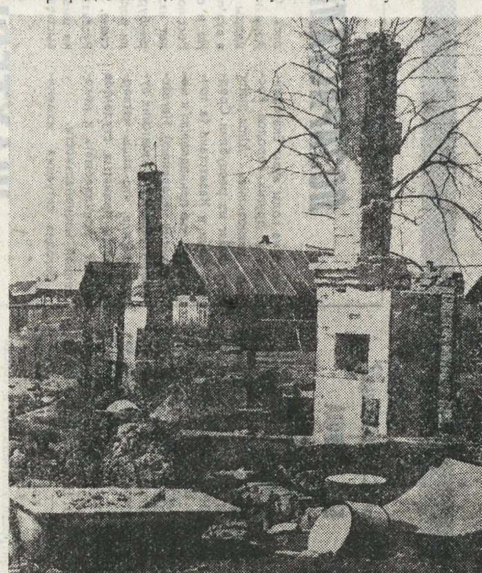
Интервью взяла Т. КОРШУНОВА. НА СНИМКЕ: все, что осталось от Липовки...

— Чем вызвана такая чрезвычайная обстановка? — Прежде всего за последнее время значительно ослабли требования пожарной безопасности. Если раньше на большинстве предприятий следили за соблюдением правил пожарной безопасности, то сейчас, похоже, администрация махнула на все рукой. Все чаще стали происходить загорания из-за неполадок технологического оборудования. Думается, не случайно. Ста-