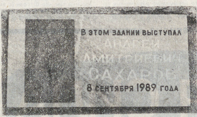
В ЭТОМ ЗДАНИИ ВЫСТУПАЛ 8 СЕНТЯБРЯ 1989 ГОДА