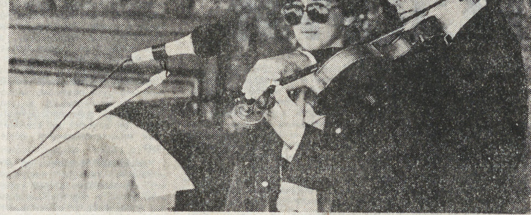
В этот день в Екатеринбурге на здании Дворца молодежи открыта мемориальная доска...