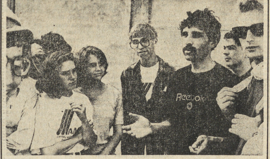
РАЙ В «ШАЛАШЕ-92»