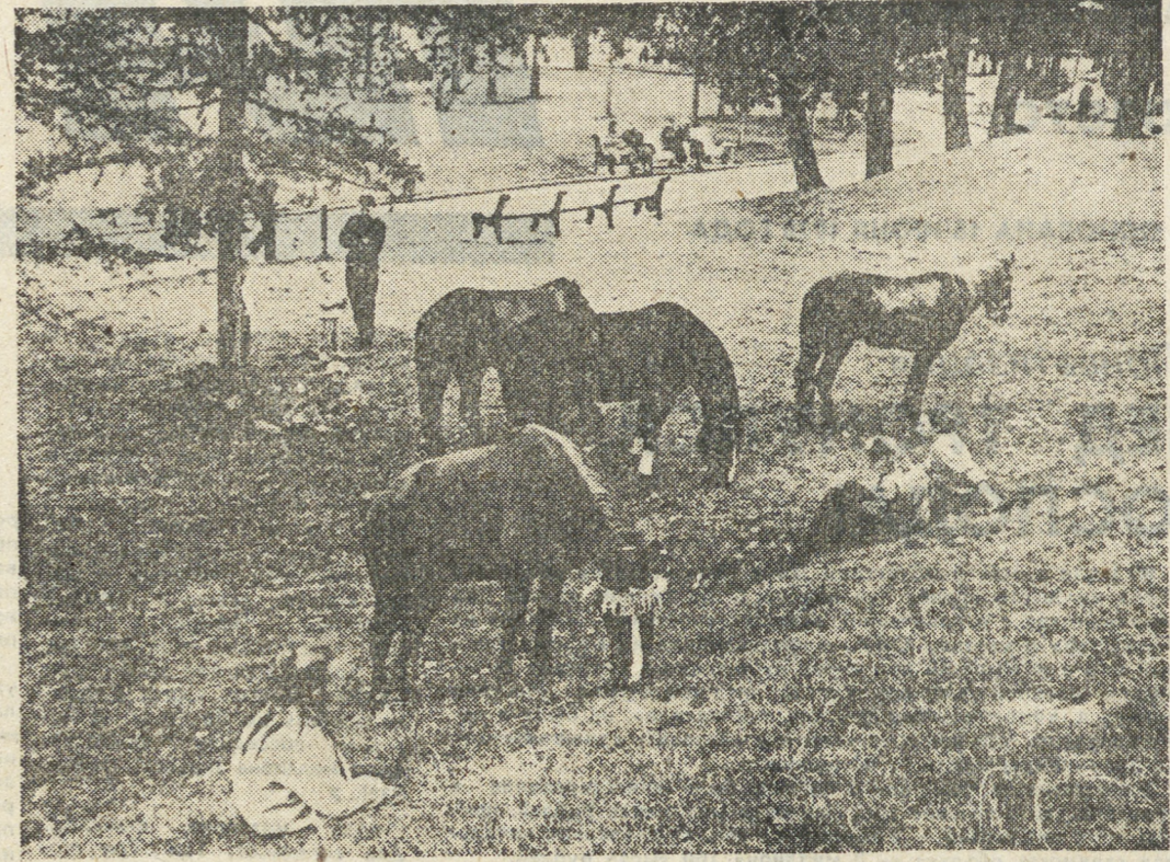
Эх, вы, кони, мои кони!..

Но не все так просто. Иные старики, забывая в сельсовете яркие заморские мешки, слыла, бражливо спрашивали: «А где сахар? Или — а масла почему нет?» Требовательно так, строго, как будто американцы им что-то задолжали. Иные, впрочем, так прямо и понимают и высказываются в том духе, что, мол, они, буржуи, кровь нашу пили, а потому должны теперь нас кормить. Слышала я и такие паритические опасения — совершенно в духе наших грамотных красных патриотов! — что, мол, американцы хотят нас отравить. «Уму, а американскую муку есть не стану!» (Ну, жадность, конечно, моментально свое взяла).