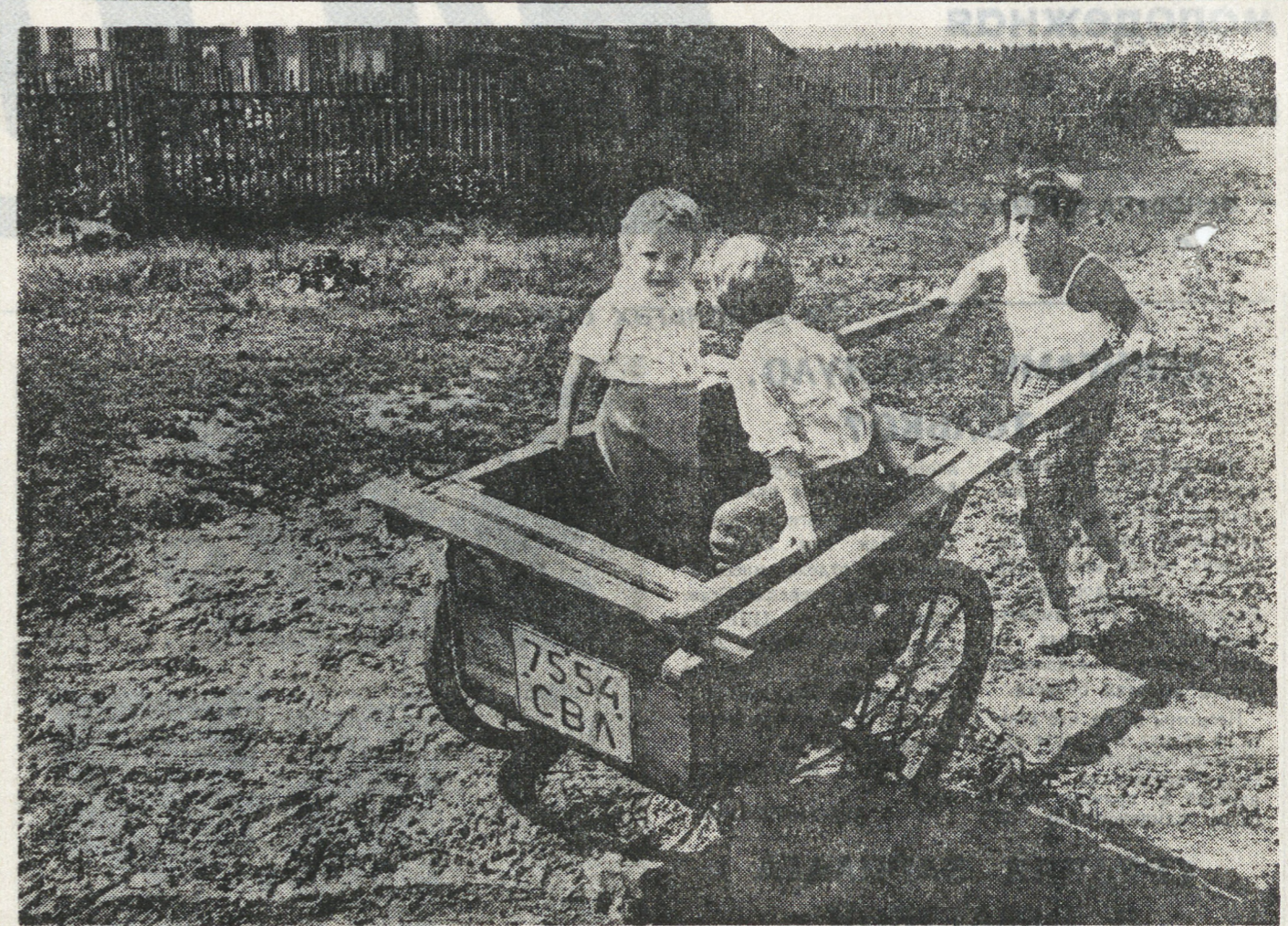
Деревенское такси.

— Да, кроме наличных денег, ГНП — это еще и большой резерв рабочих мест. Мы можем перемещать сюда людей с основного производства в случае, если там будет необходимо сокращение выпуска продукции.