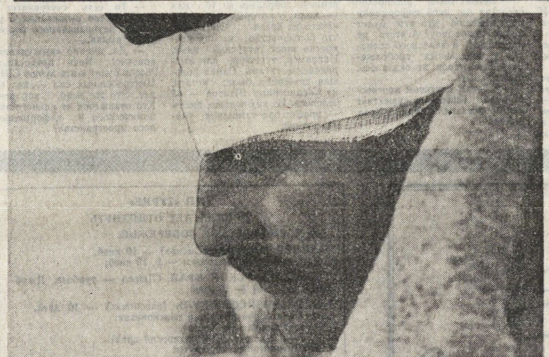
Армения. Ерасх. В зоне боевых действий на границе с Нахичеванской республикой.