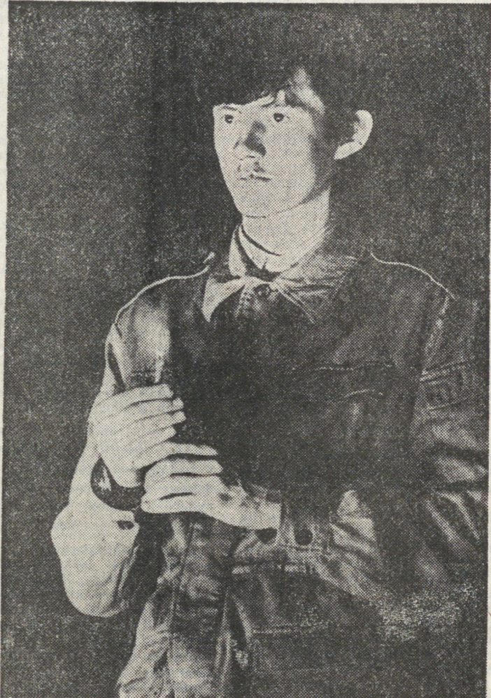
Большой интерес к поисковым отрядам проявляют потомки тех, кто воевал по другую сторону линии фронта...