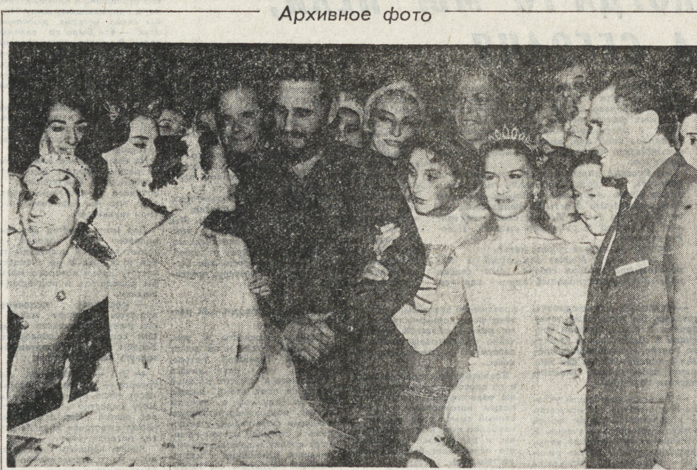
НА СНИМКЕ: Фидель Кастро с артистами балета Большого театра. Вторая слева — М. М. Плисецкая.