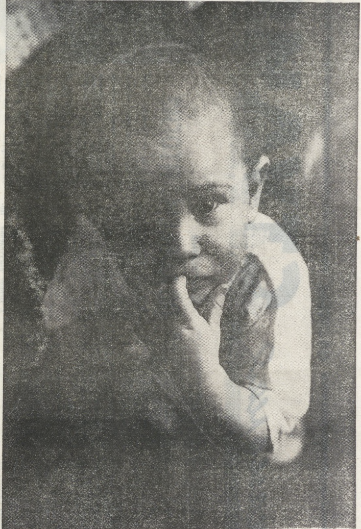
В глазах — надежда и тоска.