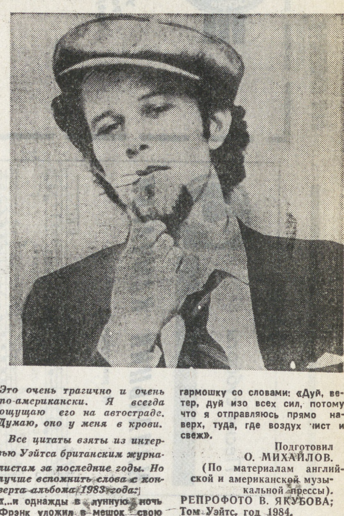
Это очень трагично и очень по-американски. Я всегда ощущаю его на автограде. Думаю, оно у меня в крови. Екатеринбург.

При схожей внешней тематической направленности песен Уэйтса и Брюса Спрингстина (оба родились в 1942 году), они очень различны. Спрингстин воет себе. Уэйтс — о своих героях, за которыми наблюдал, работая по кабакам — то вышибалой, то поваром, то официантом.