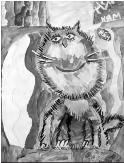
«Грезы кота Васьки», автор Максим Уткин.