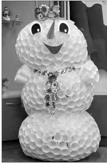
«Снеговик» ребят из детского сада №185.