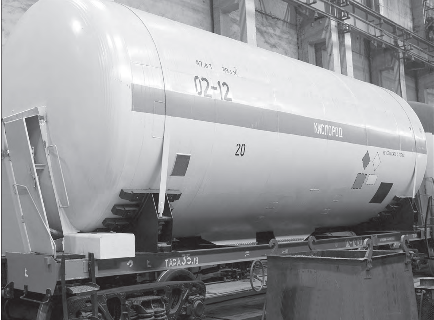
Прототип цистерны 15-558 С-03 для транспортировки топлива на «Восточный» уже готов.