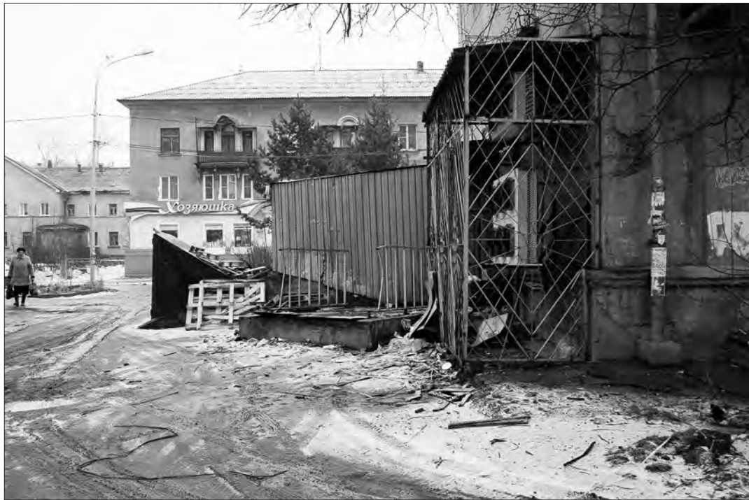
Очень неприглядная картина за «Монеткой» по улице Пархоменко, 131.

Краснодарская торговая сеть «Магнит» - самая рас-пространенная и популяр-ная в Нижнем Тагиле. Как рассказал директор Нижне-