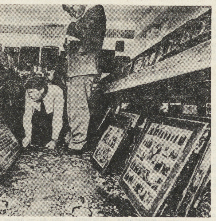
Эмигранты из России создают мафию в Берлине. Они занимаются вымогательством денег и контрабандой икон.