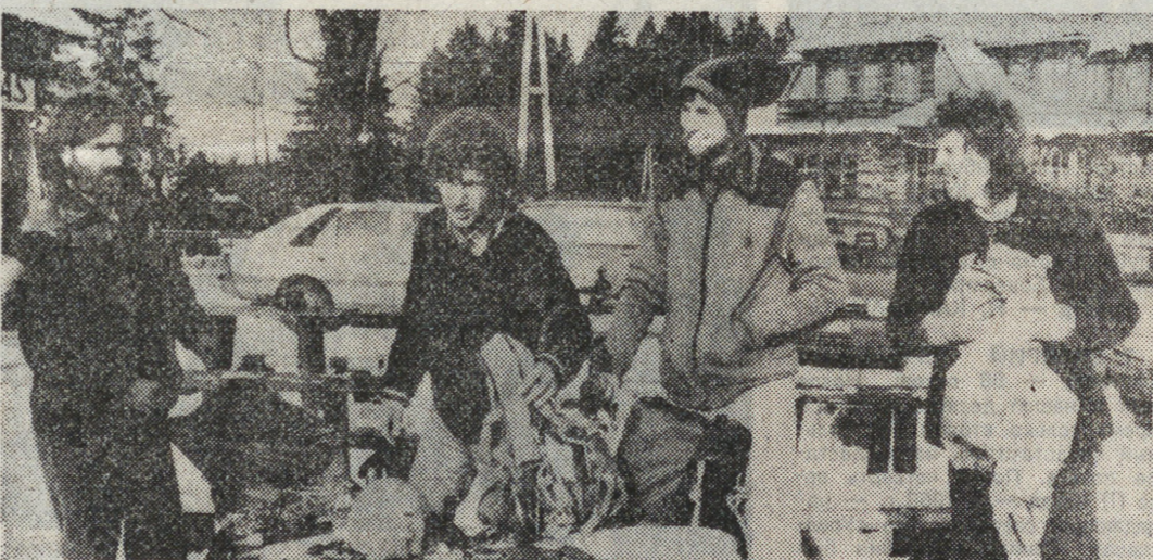
Поставлен еще один мировой рекорд в области спелеологии. Он принадлежит чешскому молодому спелеологу, который пролежал в снежной пещере в Татрах 195 часов. Теперь перед ними стояла новая задача: со дня пещеры без специального оборудования подняться на высоту 775 метров. Предыдущий рекорд равнялся 680 метрам. НА СНИМКЕ: спелеологи после выхода на открытый воздух.

А. КЕРЖЕНЦЕВ, корр. ИТАР-ТАСС, Тель-Авив.