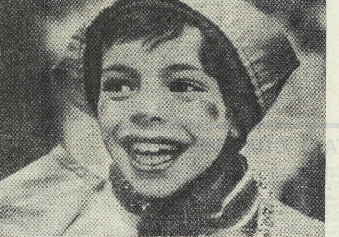
«Весна в окно стучится...» (На проводах русской зимы).