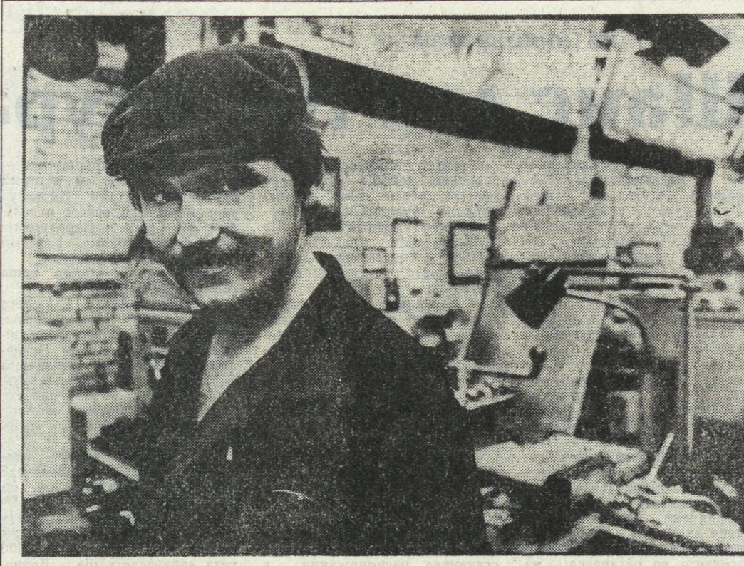
Опытные рабочие прекрасно знают, что любой станок слушается только хорошего хозяина, только в его руках работает без сучка, без задоринки. Жаль, что теперь таких заботливых хозяев мало, и профмастерам приходится пользоваться особым престижем у молодежи...