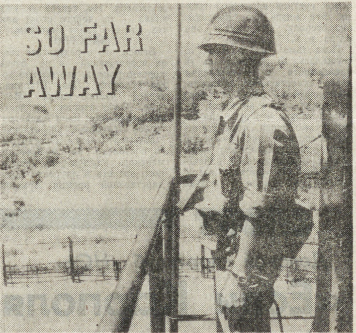
пока слишком слаб, чтобы абсорбировать хозяйство Севера.

В этих условиях на Севере Кореи говорят о возможном сроке урегулирования в 1995 году. На Юге — называют конец XX века.