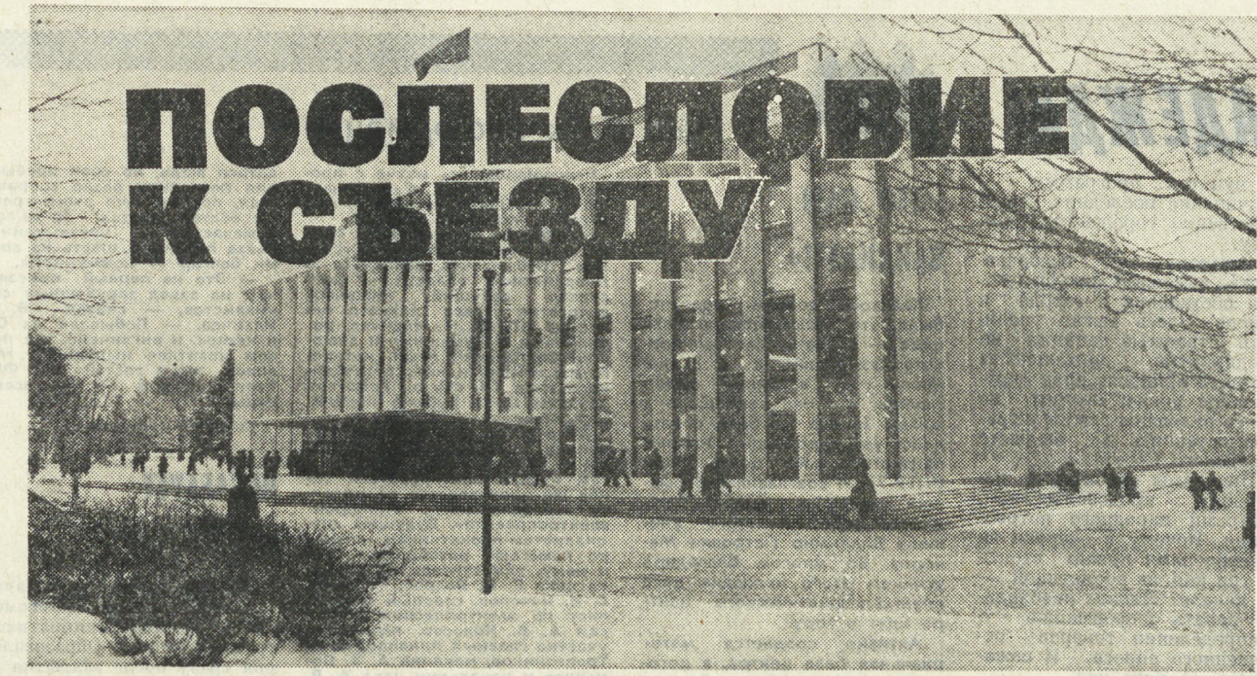
ПОСЛЕСЛОВИЕ К СЪЕЗДУ

дали тому же председателю пришлось увещивать еще и грузинскую делегацию? Не передавала программа «Время» и интервью с представителями молдавской делегации, которые, собравшись тоже досрочно покинуть Съезд в связи с событиями в Румынии, открыто заявили западным журналистам: если в соседней стране не установится демократический режим, в Молдавии есть все основания войти в состав румынского государства, благо что и родственники там есть, и язык общий. Драматично складывались и отношения в межрегиональной депутатской группе, стремившейся выйти на Съезде с альтернативными идеями. Однако изменившая политическая ситуация привнесла новизну и в МДГ. Среди тех, кто одним из первых почувствовал раздор в группе и необходимость поиска консенсуса, был Г. Бурбулис. Он первым поставил под сомнение работоспособность «института сопредседателей» в МДГ. Позиция по этому поводу разошлась. В нашем «Послесловии» хотелось бы представить обе. И разумеется — мы не ограничим разговор темой МДГ.