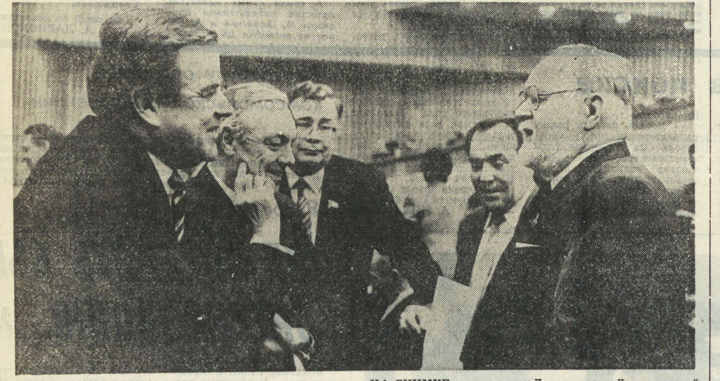
МОСКВА. Кремлевский Дворец съездов. Второй Съезд народных депутатов СССР. НА СНИМКЕ: депутаты из Ленинграда и Ленинградской области в зале заседаний.