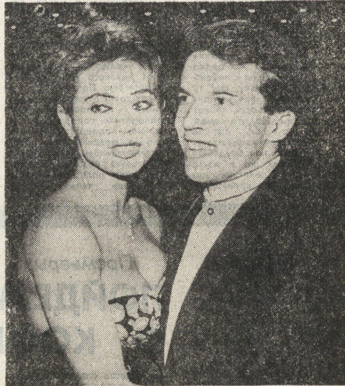
Уже если жениться, так на королеве. Тем более королю. Так можно прокомментировать снимок агента Кейстона...