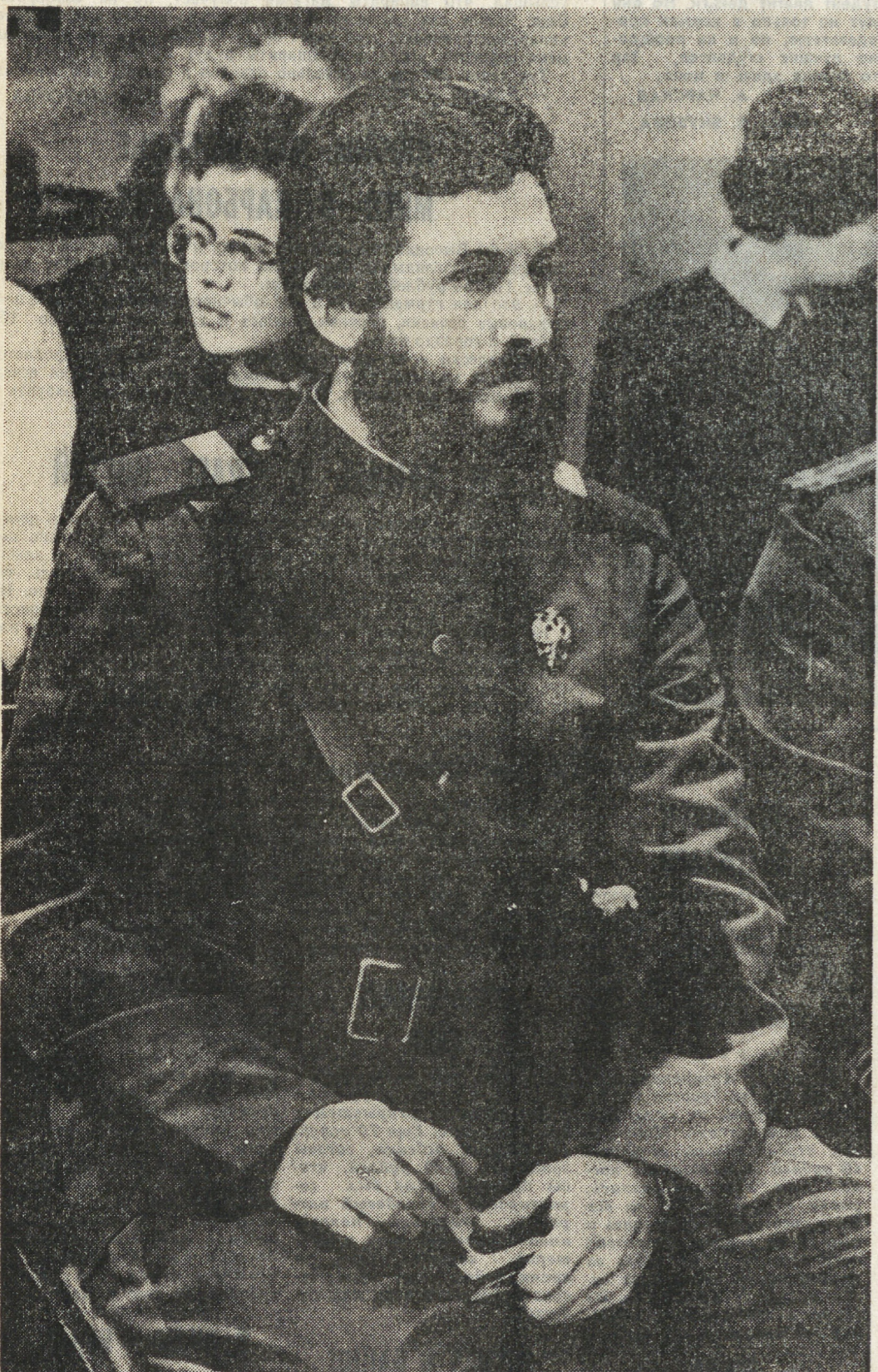
Да разве найдутся на свете такие огни, муки и такая сила, которые бы пересилили русскую силу.