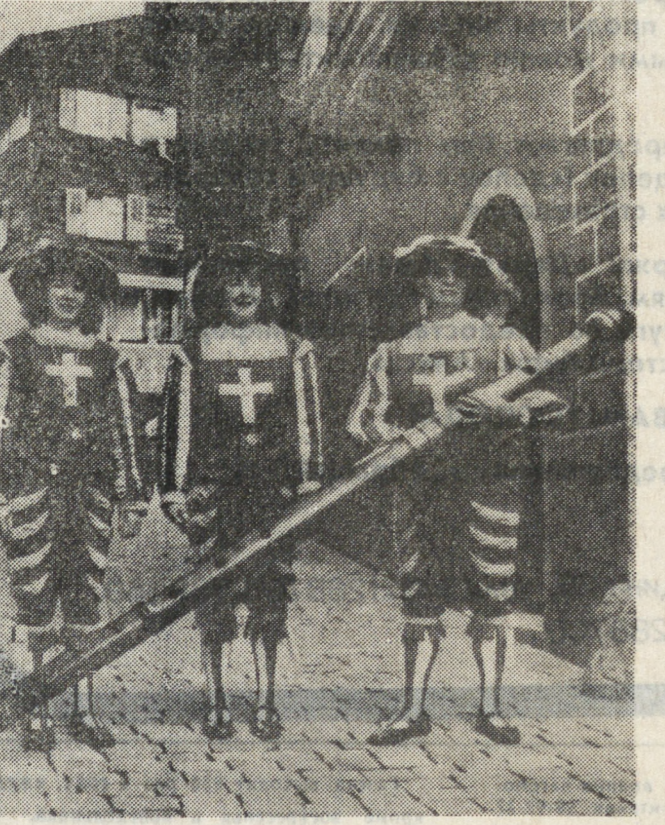
На этом снимке три жителя города Натерс (швейцарский кантон Валле) в маскарадных костюмах демонстрируют самую большую в мире флейту. Размеры гигантского духового инструмента: два метра шестидесять семь сантиметров в длину и три сорок в диаметре.

Идея его создания родилась в Финляндии несколько месяцев назад как своеобразный компромисс на требование финских организаций страны разрешить женщинам служить в армии на добровольной основе. Реакцию оно вызвало далеко не однозначную.