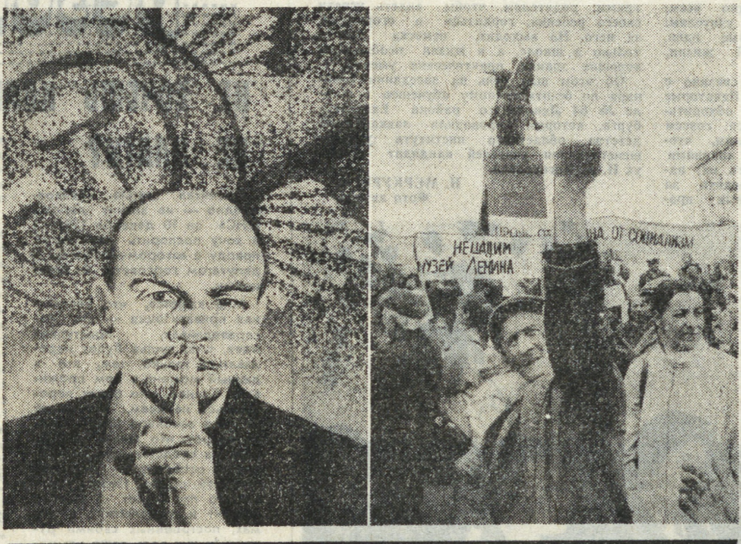
Общеотказаться от национально-территориального принципа.

Если обратиться к истории, то можно обнаружить, что идея государственного строительства по национально-территориальному принципу принадлежит даже не большевикам, а Временному правительству. В марте 1917 года оно заявило, что Россия перестает быть тюрьмой народов и проживающие в ней нации получают право на построение своей собственной государственности. Тогда это реализовано не было: не хватало времени. Но с приходом большевиков к власти, уже в 1919 году, создаются первые национально-территориальные образования: Башкирская АССР, Трудовая Коммуна Области Немцев Поволжья. В одной из своих работ в конце того же года Ленин поясняет, что для