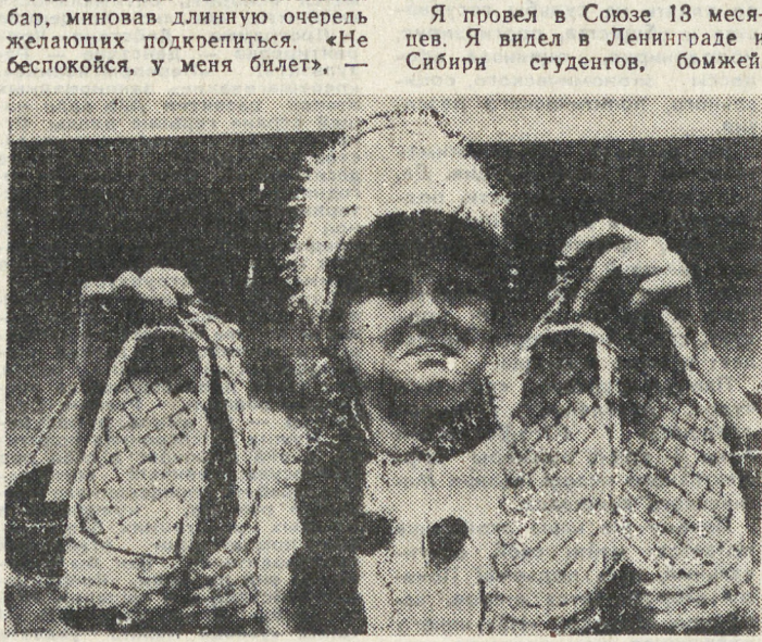
МАРИЯНСКАЯ ССР. Необычный новогодний подарок получили жители республики — в магазинах появились латки. И хотя по прейскуранту новинка значится как «латки сувенирные»...

Я не разделяю большинство из появившихся в прессе высказываний политических деятелей в отношении соответствующего указа Президента РСФСР. Но считаю, что объединение двух ведомств может существенно затормозить их работу.