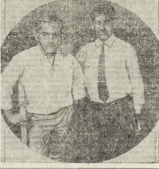
В Перскую аномальную зону, ставшую знаменитой еще после статей П. Мушгортва в латвийской газете «Советская молодежь», С. Казанцева (см. «Уральский следопыт» № 4, 1990 г.) и других журналистов и исследователей, а собирався с начала лета.

Идти решили все. А в 11 часов меня отключили. Мыслей не было, но я отчетливо слышал, о чем говорили участники предстоящего контакта. Вокруг меня была темнота, я ничего не осознавал. Я прокрутил в голове последние события. Вдур я увидел реба, пошла чей время вконец 12-ти, стали сбираться. Место контакта Поля чудес, о которого мы