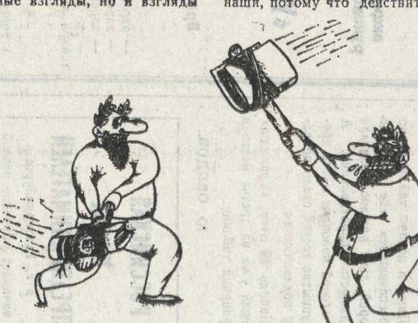
С. МАТЮХИН. Рис. В. ШИЛОВА.

С Литвой все ясно. А вот что будет с Россией — как вы думаете, не пойдет ли она по югославскому пути? — Я думаю, нам никуда от этого не деться. При всем желании. Знаете, когда югославия год назад говорила: ребята, останьтесь, либо начните убивать друг друга, выпустить друг друга кишки и насадить жен своих соседей — они смеялись. Они думали, что это нехерально.