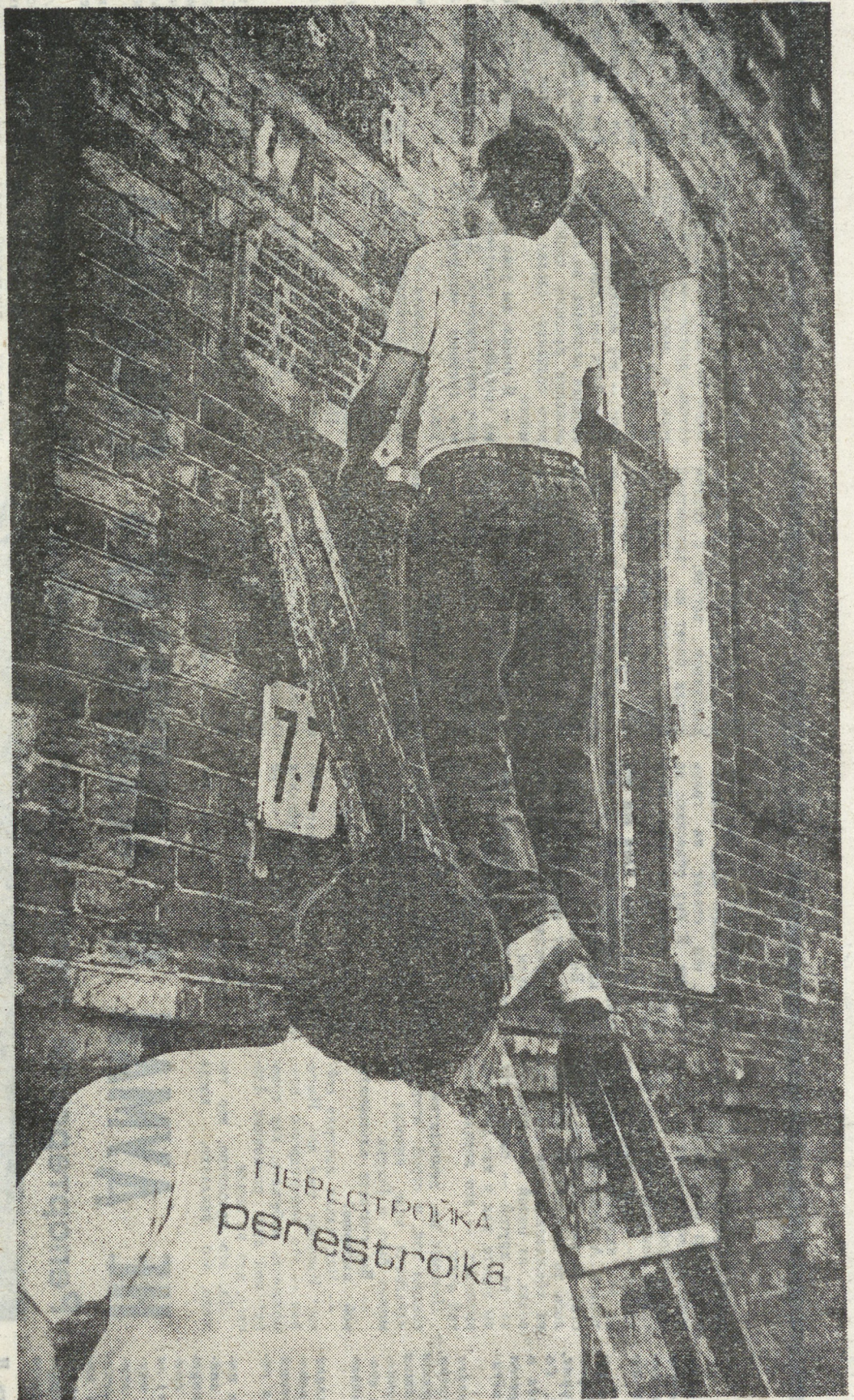
Смена вывесок. Не перестараться бы...