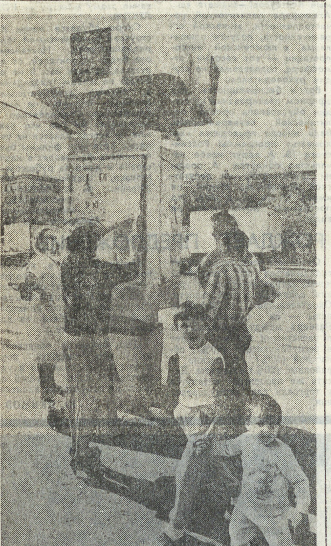
«МЫ НЕ СОБСТВЕННОСТЬ ПАРТИИ...»

Обращаются к вам жильцы дома № 126 по улице Бебеля. На наше несчастье мы вынуждены жить в 16-этажном доме. И как только наступают теплые денки и отключается отопление, у нас начинаются проблемы с горячей водой. В этом году практически с 1 июня горячей воды у нас нет. Как объясняют работники ЖКО № 10, не хватает давления и виновата ТЭЦ, обслуживающая наш дом. Работники ТЭЦ говорят, что в высотных домах в это время должны работать насосы, и эту работу