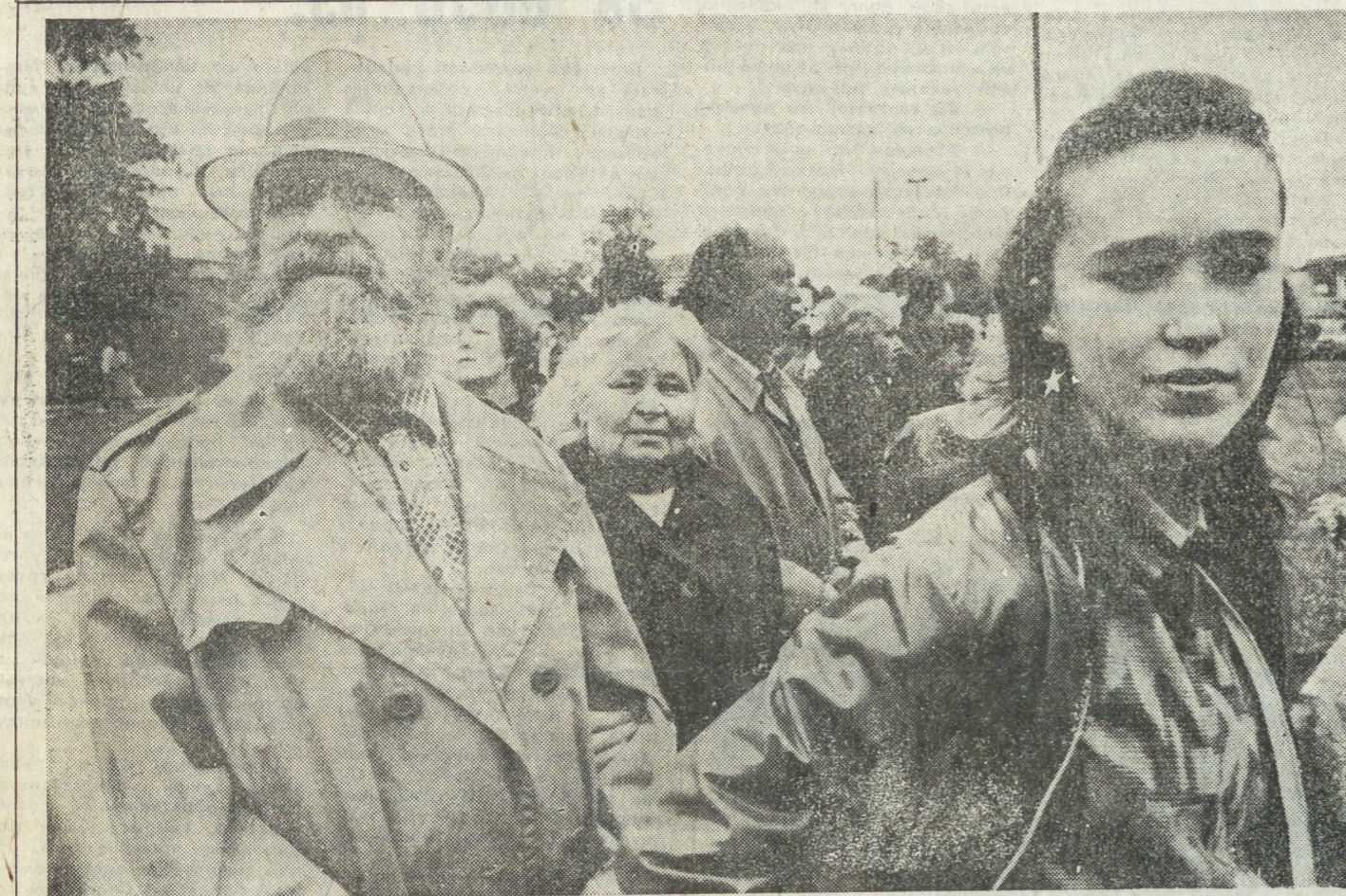
На празднике.