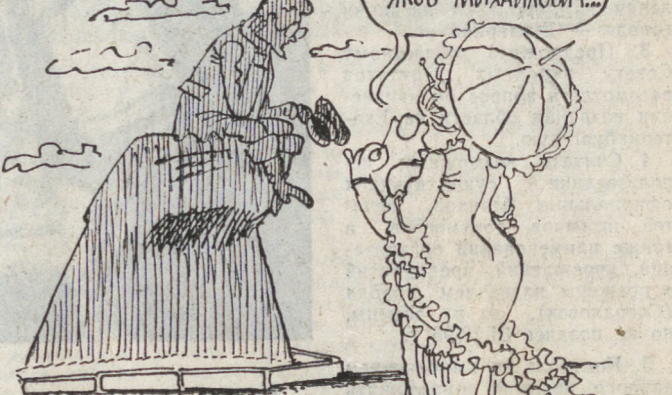
Решение о возвращении Свердловску его исторического названия — Екатеринбург предстоит утвердить в Верховном Совете России.