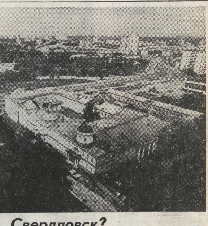
Решение о возвращении Свердловску его исторического названия — Екатеринбург предстоит утвердить в Верховном Совете России.

нас затянет в свою трясину по уши, откуда нам уже не выбраться. В этой связи мы обращаемся к нашим новоявленным бизнесменам: торопитесь урвать куш, пока советская «примитивизация» не стала на ноги, где можно подешевле купить и подороже продать.