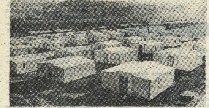
Фото и текст В. Матвеева. (ТАСС).

Армянская ССР. В центре разрушенного землетрясением Спитяка нашли теплый троп и уютное жилье 450 семей, в основном те, которые лишились в день трагедии кормильца. Его построили за считанные месяцы итальянские строители, в числе первых поселенцы на помощь армянскому народу. На удобном плато вырос современный поселок из 234 домиков. Кроме комфортабельных квартир в распоряжении новоселов магазины, объекты быта, школа, детский сад, поликлиника, где продолжают работать итальянские врачи. В скором времени в поселке откроется и новая больница. НА СНИМКЕ: итальянский поселок в Спитяке.