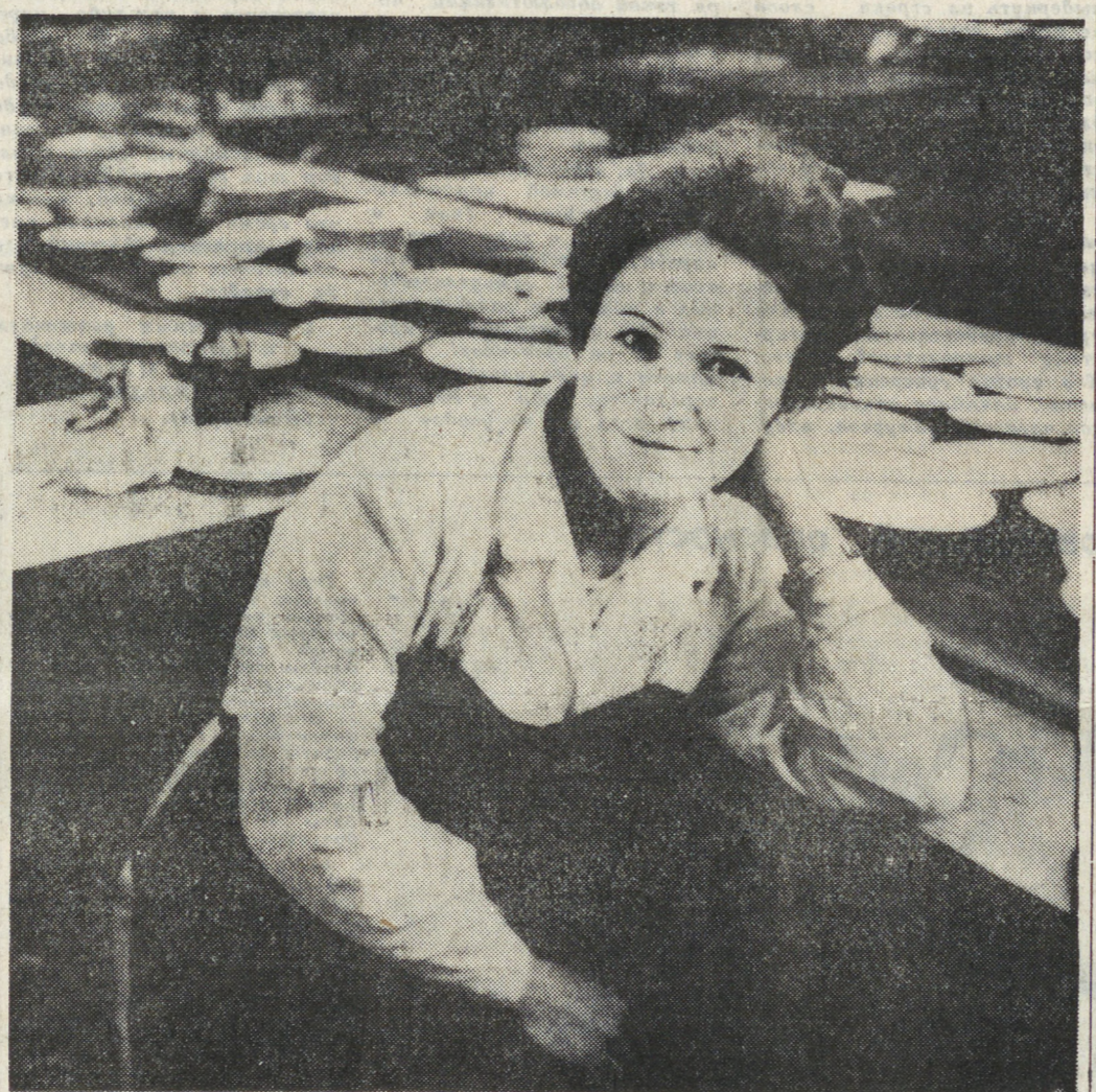
Те, кто занимается производством посуды знают, что такое отбойчик. Ну кто придумал для этого дела такое прекрасное название! Ведь прекрасная работа, которую делают отбойчицы. Вы видели, например, посуду Богдановичского фарфорового завода (если повезло ее увидеть в последнее время на прилавках «Хотюваров» области)? Правда, это не вина завода — его беда и беда экономики. Но тем не менее...