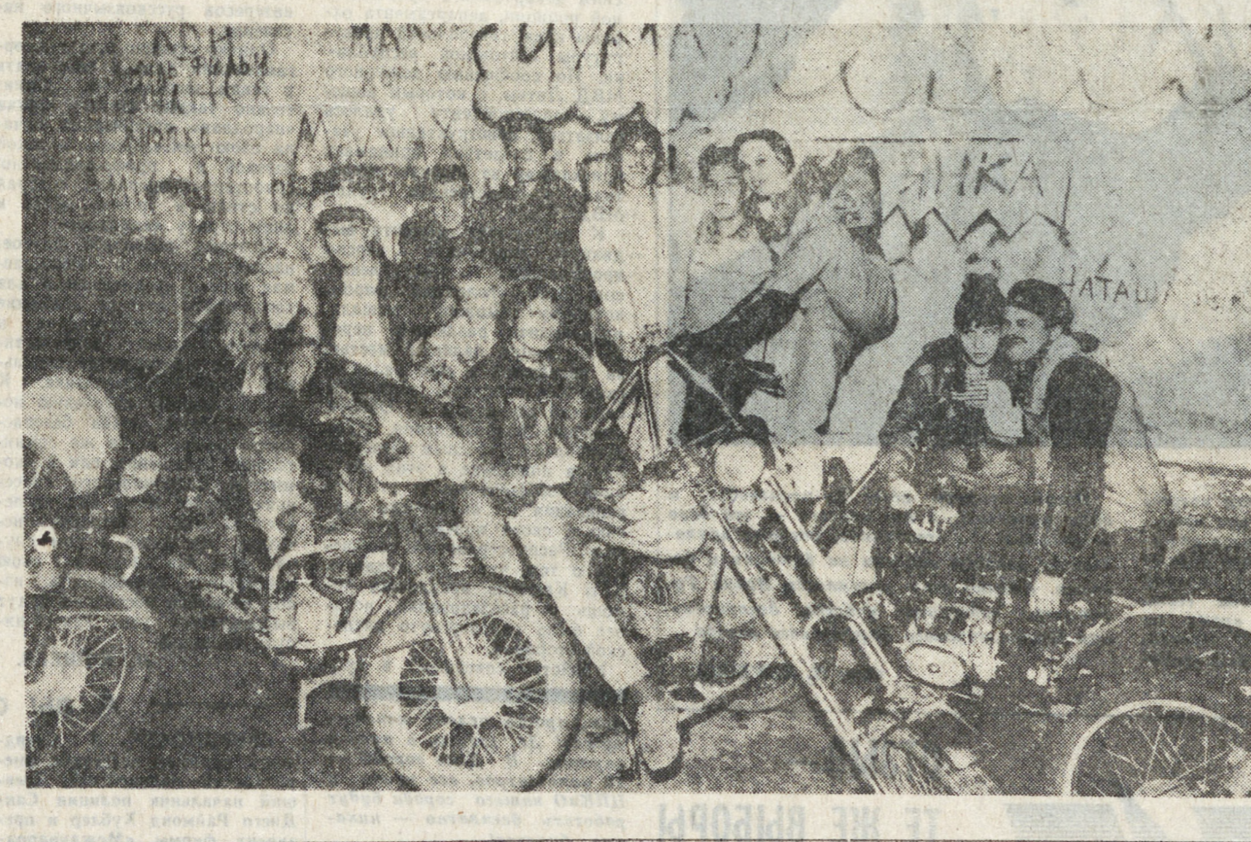
Года два назад ночные московские улицы оглашались бесшумным ревом мотоциклов. Из которых бравые парни с отчаянной скоростью мчались к местам своих тусовок. Сегодня количество участников рокерских заездов заметно поубавилось, но специальному звонку мотоциклистов ГАИ еще хватает работы по пресечению угрозы жизни пешеходов, которую создают икрутые мотопарни. И сомнительно, хватает ли работ на хирургам городских больниц.

Да, на тусовку в Лунинки («В Луку») съезжаются, пожалуй, теперь самые прелевые и закаленные рокеры. Переживаемый страной кризис, затронувший всех, — от старика до ребенка, — их тоже не обошел. Почти невозможно молотком купить мотоцикл (в среднем он стоит теперь 6 тысяч), достать запчасти — значит, свое «стелле». Введение внушительных штрафов тоже ударило по парням: раньше-то они частенько без прав, а о превышении скорости и говорить не приходилось.