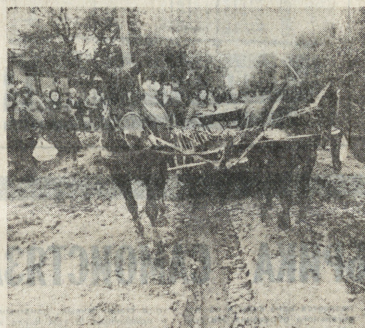
Как живем — так и умираем...

В 70-е годы, когда А. Вознесенский писал это стихотворение, еще не стояла проблема конвертируемости рубля, и поэт имел в виду другое: этот человек не для замусоленных бумажек. А вот запорочские любители рока утверждают, что не стоит применять меры «по-вознесенски». Нам поможет... Ян Гиллан. Бывший солист группы «Deep Purple» во время своих гастролов в Запорожье оставил десятки автографов на «дезервированных» рублях, после чего их стоимость выросла в 40 раз. Может, Мишину не денежную реформу стоит проводить, а пригласить Гиллана еще раз на более длительный срок, чтобы он расписался на всех ассигновках Госбанка СССР?