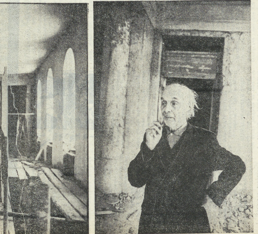
НА СНИМКАХ: вот так смотрит на набережную особняк Тарасова, а так он смотрит на тех, кто вошел внутрь; П. И. ЛАНТРАТОВ.