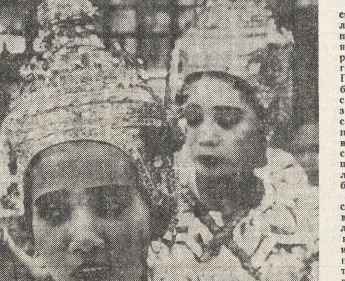
ТАИЛАНД. Самый большой религиозный праздник Тайланда — «Виджая Пуца», когда отмечается одновременно День рождения, Просветления и Вознесения Будды на небо.

Будда — имя, данное основателю буддизма Сиддхартхе Гаутаме. В религии буддизма — это существо, достигшее состояния высшего совершенства (просветления).