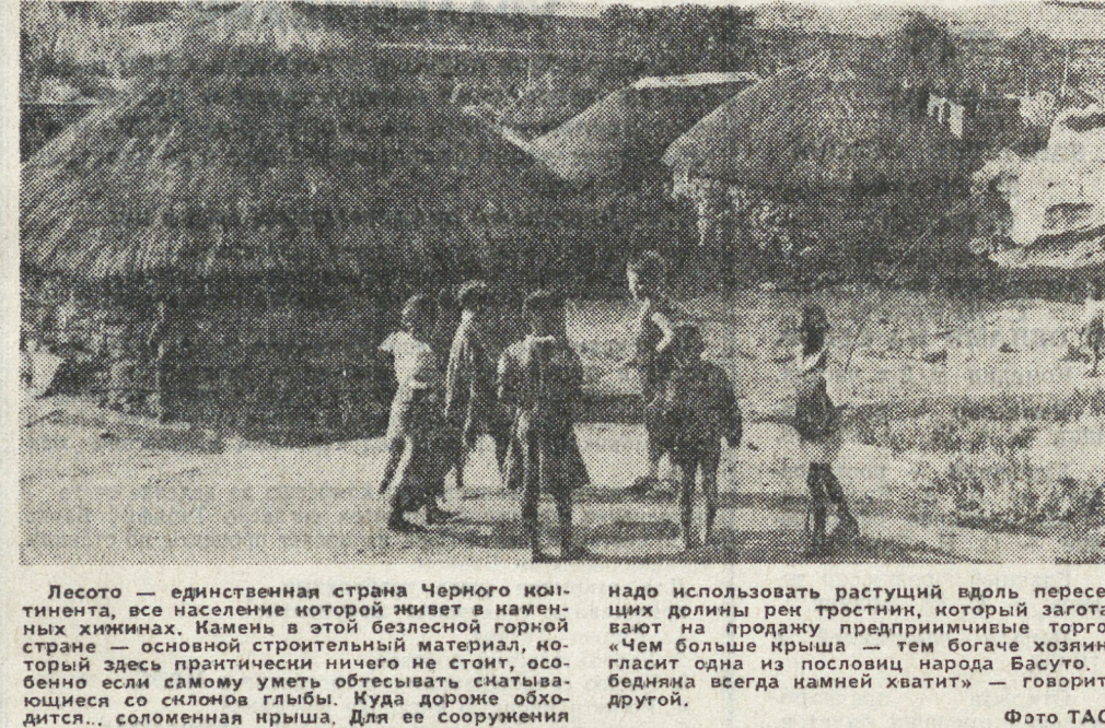
Лесото — единственная страна Черного континента, все население которой живет в каменных хижинах.

Лесото — единственная страна Черного континента, все население которой живет в каменных хижинах. Камень в этой безлесной горной стране — основной строительный материал.