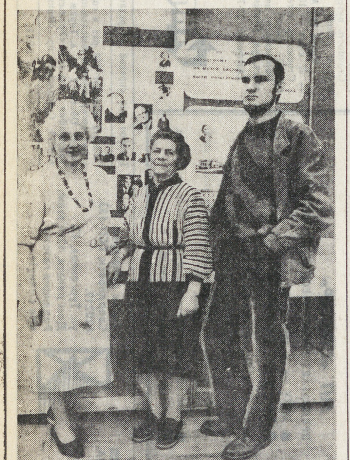
Искусству торговать, общаться с партнерами, вести дела и строить экономические связи, быть рачительным хозяином и щедрым меценатом учит выставка «Россия деловая». Она организована в Московском институте народного хозяйства имени Г. В. Плеханова. Экспозиция создана благодаря энергичным людям: преподавателям, служащим, студентам института, которые провели колоссальную работу по сбору материала и его быстрому оформлению.