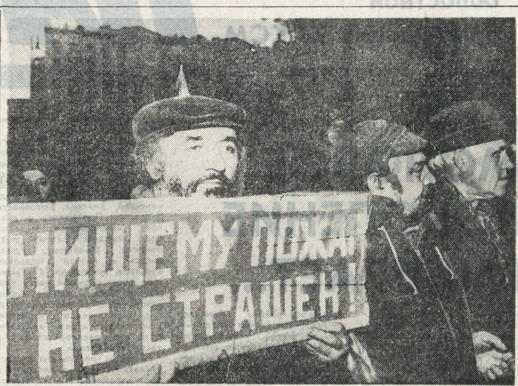
«Как живешь, столица?» НА СНИМКЕ: «Возьмемся за руки, друзья...» (Фотохроника ТАСС).