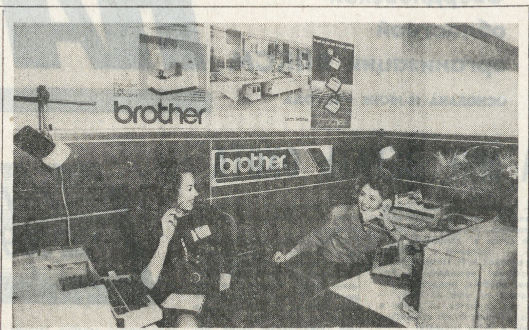
УКРАИНСКАЯ ССР. В Днепрпетровске открылся бизнес-клуб «КОМИНФО». Теперь у деловых людей Приднепровья и их гостей есть место, где можно обсудить проблемы, подписать контракты, отдохнуть. К услугам предпринимателей конференц-зал, гостиные, выставочные залы, автономная система телевидения, которая обеспечивает постоянный канал «Биржевые ведомости». Готов к работе вычислительный центр, где будут стываться предложения, поступающие от деловых партнеров, в том числе и зарубежных.

С. МАТЮХИН. Народ и партия. Едины?