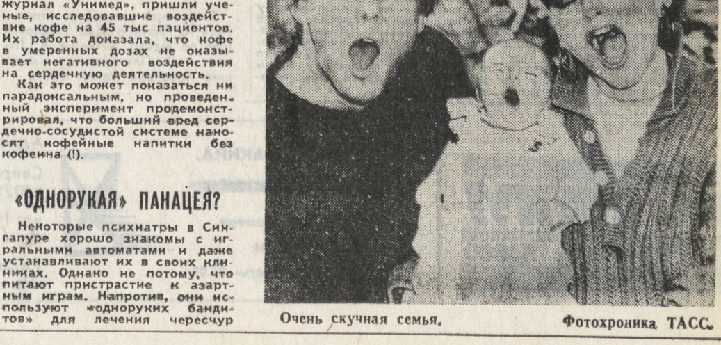
Очень скучная семья.