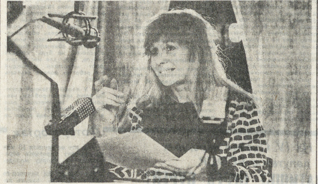
КАЗАХСКАЯ ССР. «Говорите по-немецки» — цикл передач под такой рубрикой организовал на Павлодарском областном радио. Инициатором их стал областной совет Всесоюзного общества советских немцев, а спонсором — немецкий колхоз имени Кирова Павлодарского района. Сами уроки подготовлены Мюнхенским университетом и в звукозаписи представлены обществу «Возрождение» через посольство Германии в Москве.