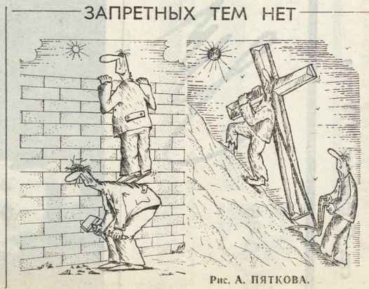
Рис. А. ПЯТКОВА.

Д. МУРАТОВ, А. ПАНКРАТОВ. («Комсомолец правды»).