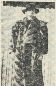
До и после свадьбы.