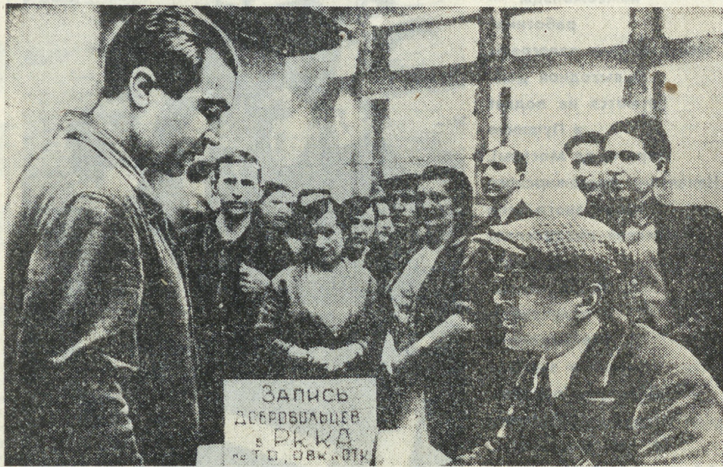
ЗАПИСЬ ДЕРЖАВЦЕВ В РККА 1941 г.