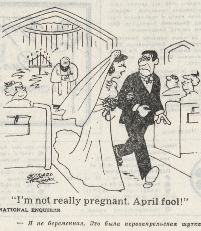
«I'm not really pregnant. April fool!»