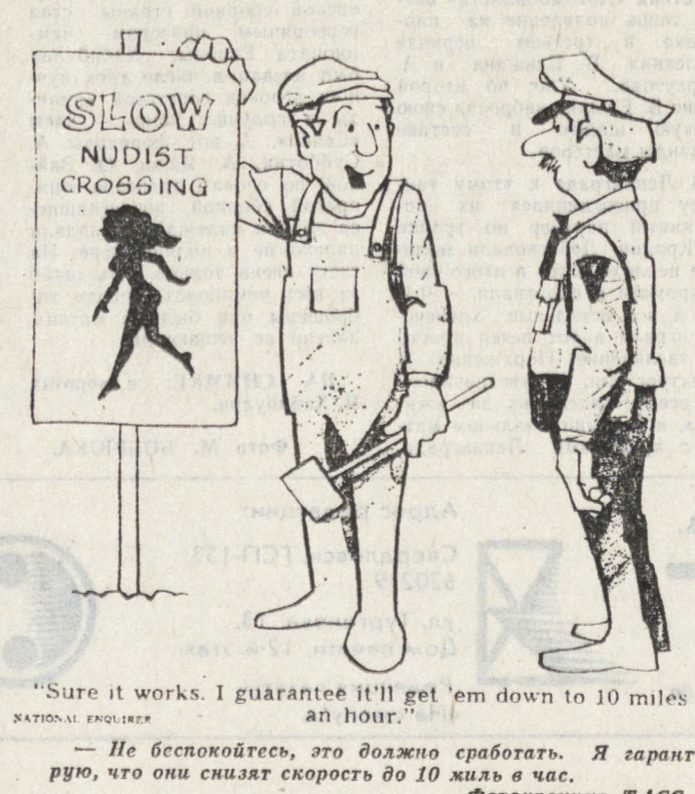
«Sure it works. I guarantee it'll get 'em down to 10 miles an hour.»