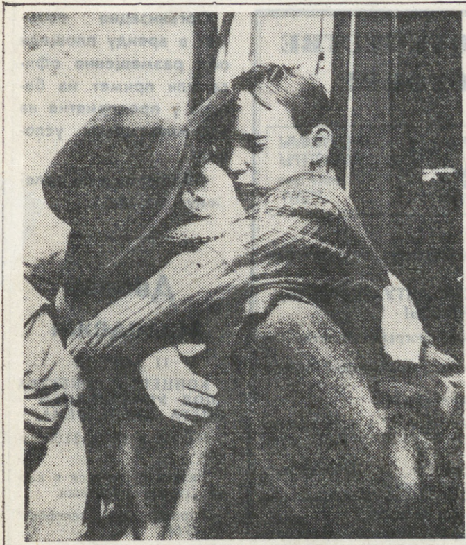
ПОЛЬША. Около 720 детей из районов Украины, пострадавших от аварии на Чернобыльской АЭС, провели месяц в Польше. Все они были госпитализированы, где встречали их только внимание и заботу, но настоящую материнскую и отеческую ласку.