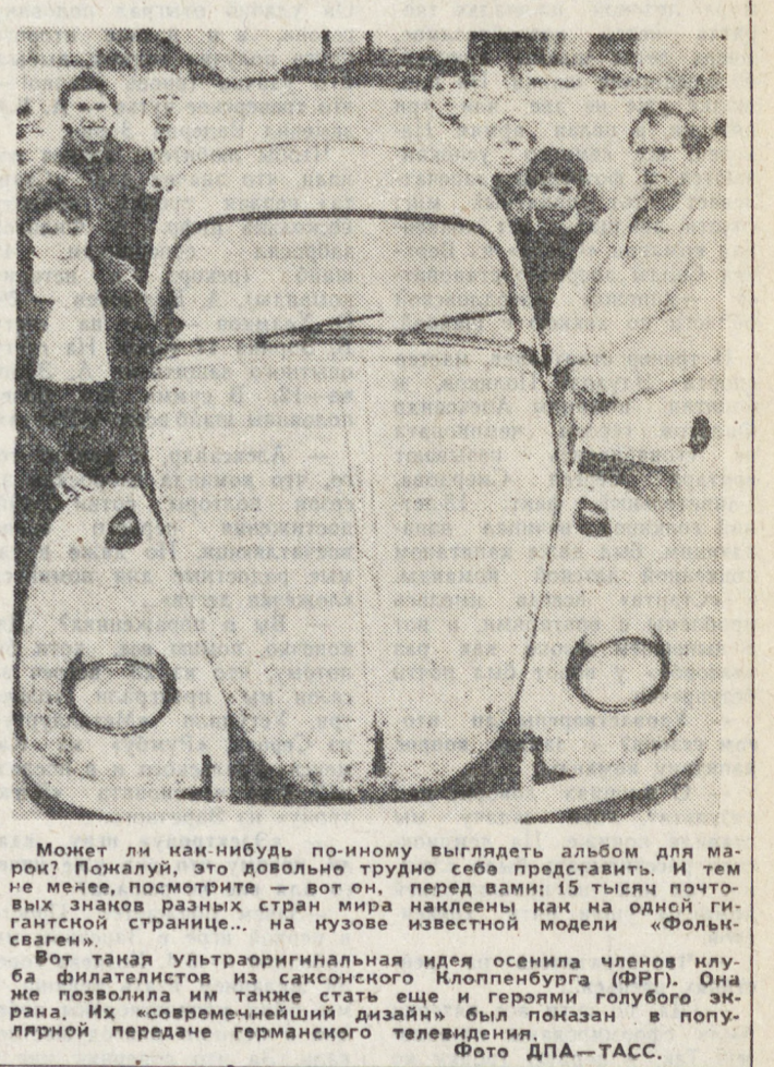
Может ли как-нибудь по-иному выглядеть альбом для марки? Пожалуй, это довольно трудная задача. Но вот перед вами 18 творческих знаков разных стран мира наклеены как на одной гигантской странице... на изюбе известной модели «Фольксваген».

Мне позволили осмотреть товары. Какие-то ошейники — не для собак, а для людей, украшенные значками с Лениным, или другие — с Лермонтовым, или еще с серпом и молотом. Цена — 66 долларов. При входе висело «плакат» повседневно, зимнее, шерстяное. Дизайнером была обозначена неизвестная мне Наташа Вольская. Цена — 530 долларов. Футболки с надписью «КГБ» — цена 18 долларов. Неизменные пеленские шкатулки. Несколько глиняных детских книжек из английского языка ценю по 6 долларов за штуку. Ну и прочие безделушки, какие обычно продаются в «Березках».