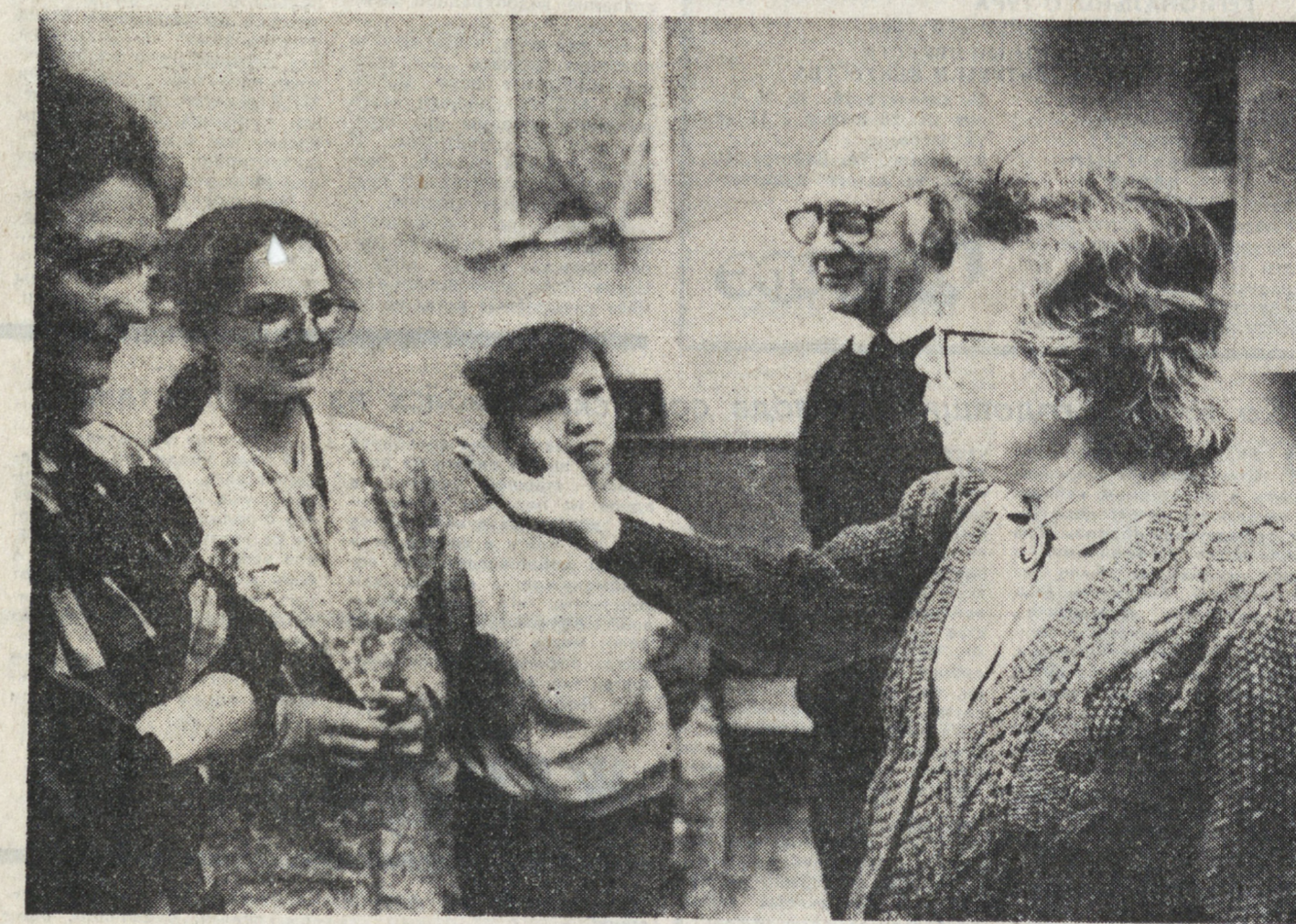
Сотрудничество «ОМНИБУС» ДРУЖБЫ

Исходя из этого, подчеркивается в документе, союз «Чернобыль» призывает все организации, партии и движения и терпимости и работе на пути к согласию во имя будущего страны, не допустить новых экологических и нравственных «чернобылей».