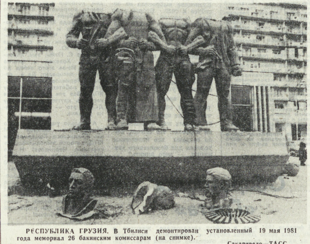
РЕСПУБЛИКА ГРУЗИЯ. В Тбилиси демонтирован установленный 19 мая 1951 года мемориал 26 бакинским комиссарам (на снимке).