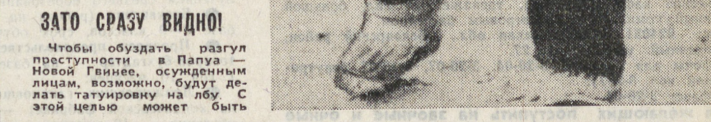
Чтобы обезопасить разгул преступности в Панау-Новом Гвинее, осужденным лицам, возможно, будут делать татуировку на лбу. С этой целью может быть