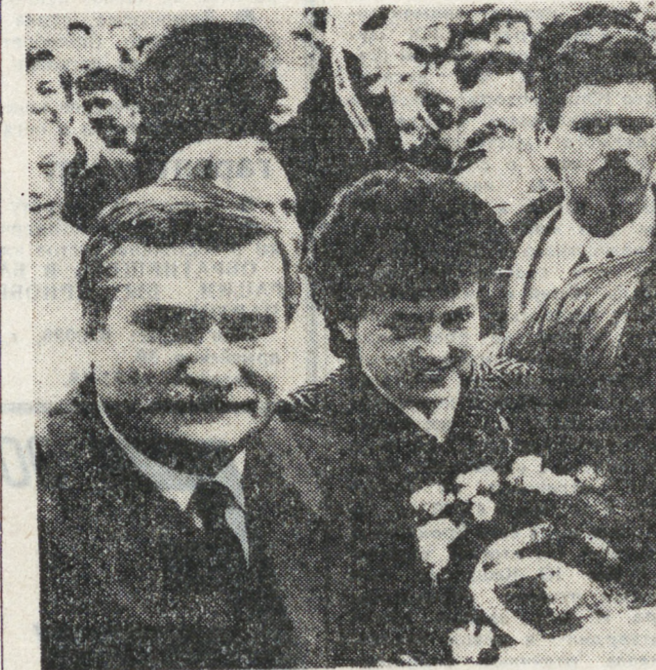
Совсем недавно президентом Польши стал 47-летний Лех Валенса...