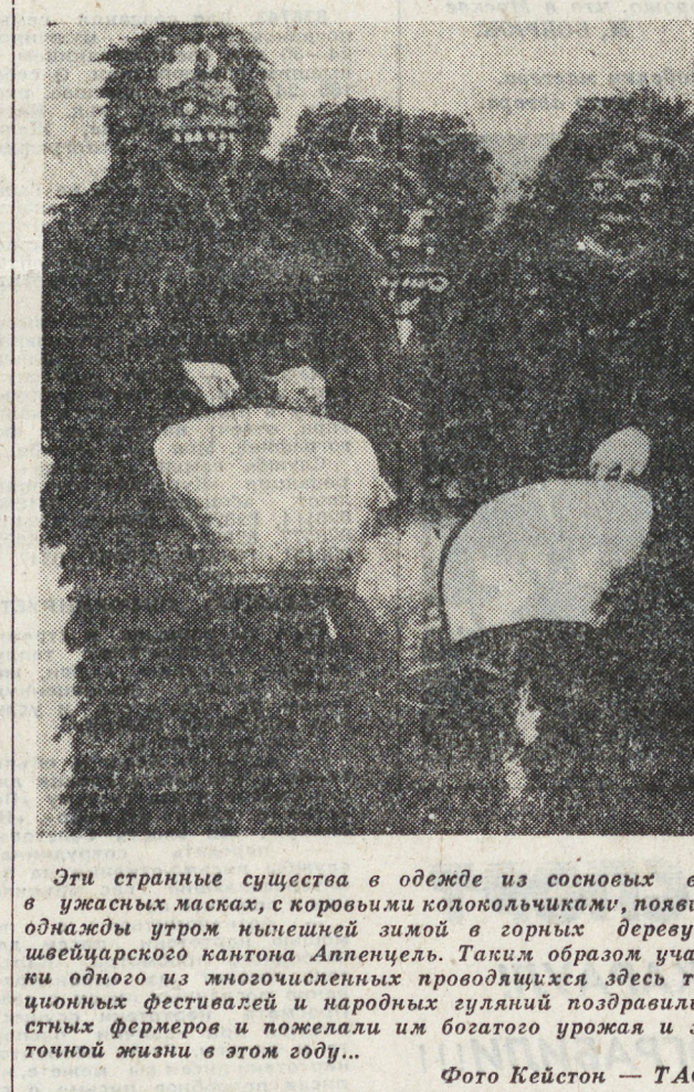
Эти странные существа в одежде из основных веток, в ужасных масках, с коровьими колокольчиками, появились однажды утром вышедшей зимой в горных деревушках швейцарского кантона Аппенцель. Таких образом участники одного из многочисленных проводивших здесь традиционных фестивалей и народных гуляний поздравили местных жителей и пожелали им богатого урожая и замечательной жизни в этом году...