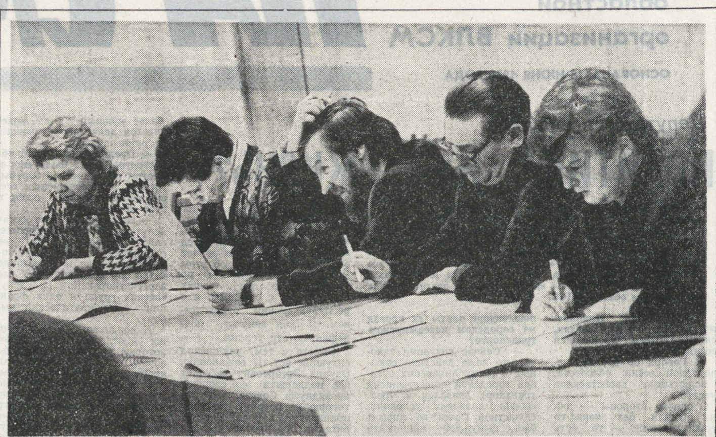
БЕЛУССКАЯ ССР. Открытием школы менеджеров начало свою деятельность в Минске малое учебно-научное предприятие «Прометей».