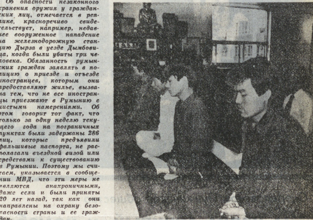
НА СНИМКЕ: во время сеанса дзен-медитации в Суэсоне.

Об опасности незаконного хранения оружия и гражданского имущества, отмечается в реплике, красноречиво свидетельствует, например, недавнее вооруженное нападение на железнодорожную станцию Дыра в уезде Дымбовица, когда были убиты три человека. Обязанность румынских граждан заглянуть в полицию и приехать в отделение иностранцев, которые они предпочитают жить, выходя на тем, что не все иностранцы приезжают в Румынию с чистыми намерениями.