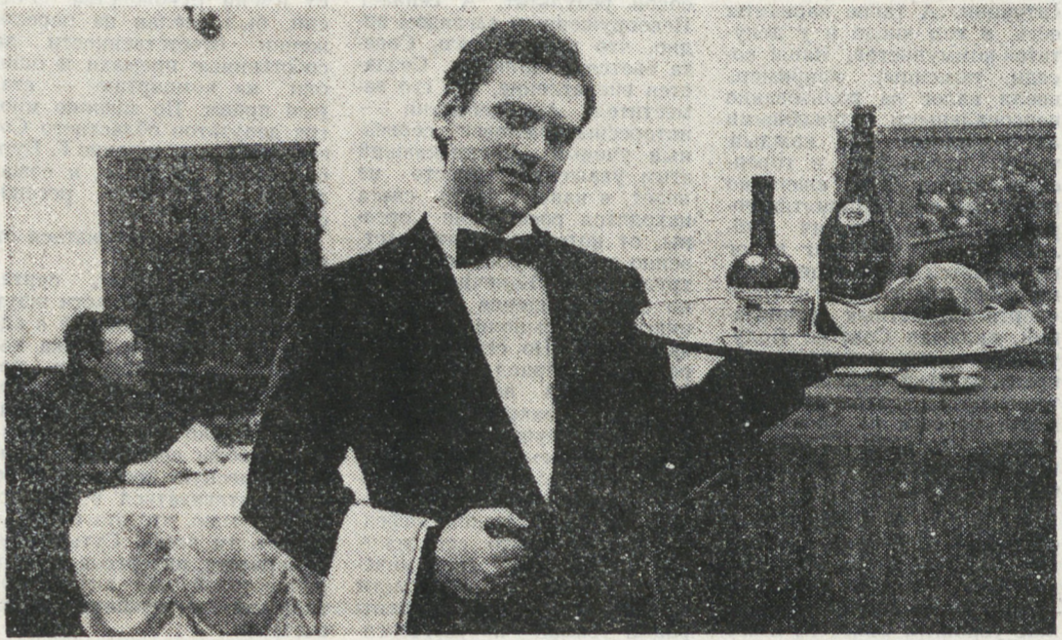
Ушли в прошлое пережитые официанты, шаржающие по ресторанным залам в шляпах и раскланивающие по полу борщ.