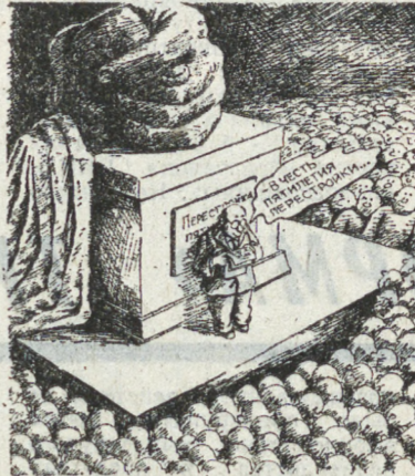
— Не расстраивайтесь, — говорит докладчик, открывая памятник, — это кушак с маслом.