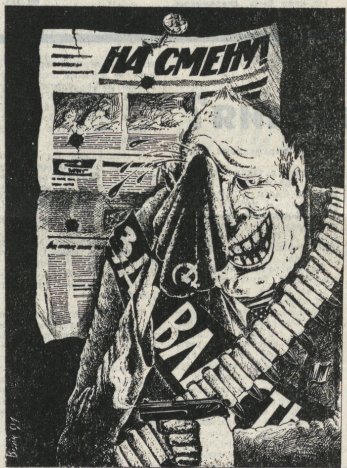
Рисунок Ю. Волкова.

Попробуй, догони в ней преступника. Все скидываешь и догоняешь босиком.