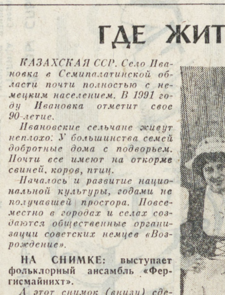
Павловские сельчане живут в мирной обстановке...

КАЗАХСКАЯ ССР. Село Павловка в Семипалатинской области почти полностью с немецким населением. В 1991 году Павловка отметит свое 90-летие.