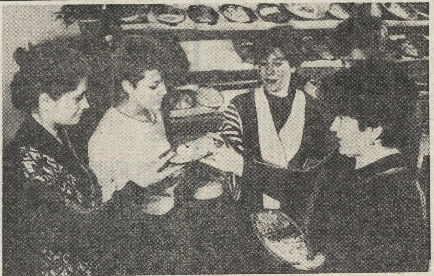
Этот снимок сделан в кабинете кулинарии Слободогуринского СПТУ-117. О сервировке столов, правильной раскладке гарнира рассказывает преподаватель спецпредме-